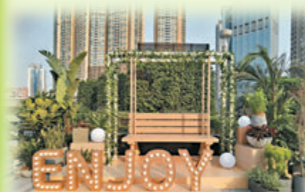
●Green Fingers 鞦韆

中應該多放鬆、充電，你也不難發現「#Go Green」的小木頭車，布滿森林總總的小盆栽，讓你恍如置身大自然綠蔭之中，教人拍個不停。走到另一邊的「部落小帳幕」，情侶或閨蜜們可以走進充滿特色的帳幕打卡，感覺分外溫馨。而「度假風藤編小窩」能讓你拍攝到一輯如置身東南亞 Resort 的照片。好動的可到「Green Fingers 鞦韆」場景，拍攝一輯有動感且具田園悠閒氣息的照片。無論是獨處或是跟好友們一起到空中花園歇息放空，不但暫且卸下心靈包袱，還可在鬧市中享受慢活寧靜感。