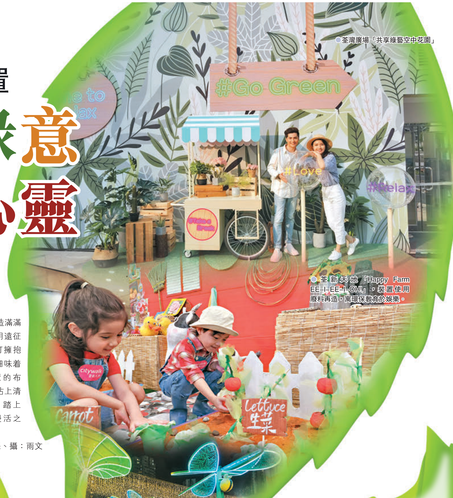
●荃新天地「Happy Farm EE-I-EE-I-OH!」，裝置使用廢料再造，寓環保教育於娛樂。