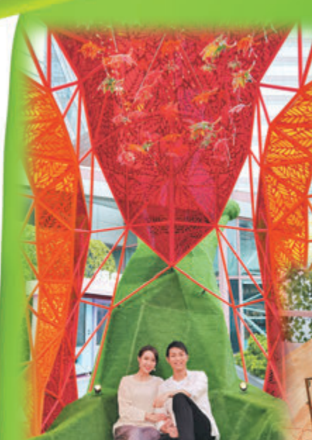
●大家可以走進蝸牛裝置內打卡拍照。