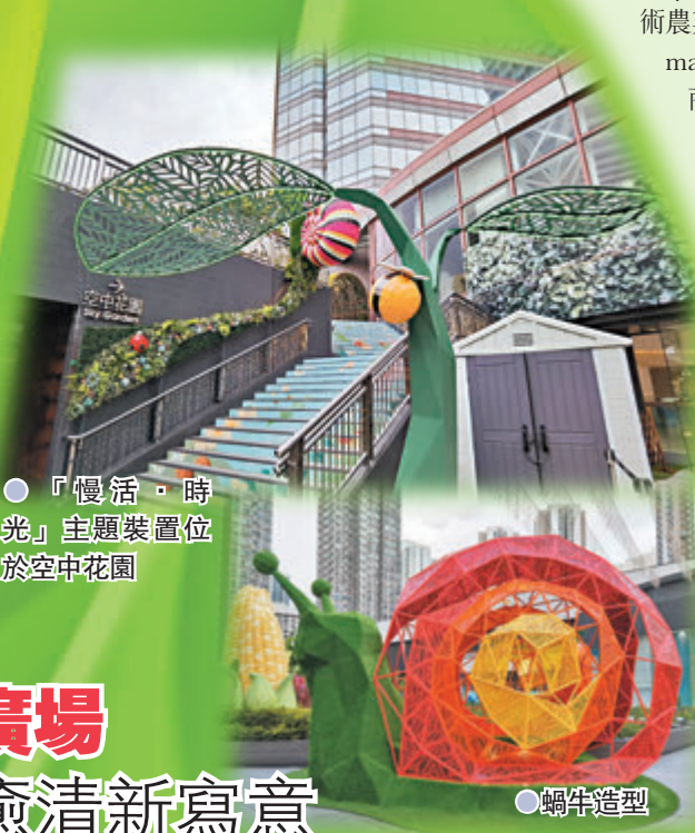
●「慢活·時光」主題裝置位於空中花園