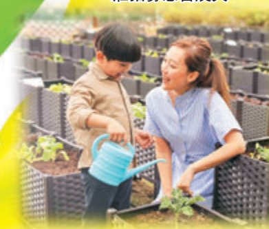
●4,000呎都市農莊招募慈善農夫

由即日起至5月16日，青衣城特意夥拍本地農場香港青年協會有機農莊，於2期天台平台花園打造了一個近4,000呎的都市農莊，並舉辦慈善「親子農耕樂」，讓大家做善事的同时，親身體驗及接觸有機耕種，透過活動推廣有機農業及相關教育活動，支持本地有機農業發展。