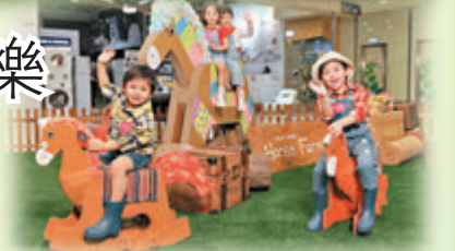
●Neigh-Neigh Horse 策騎園區