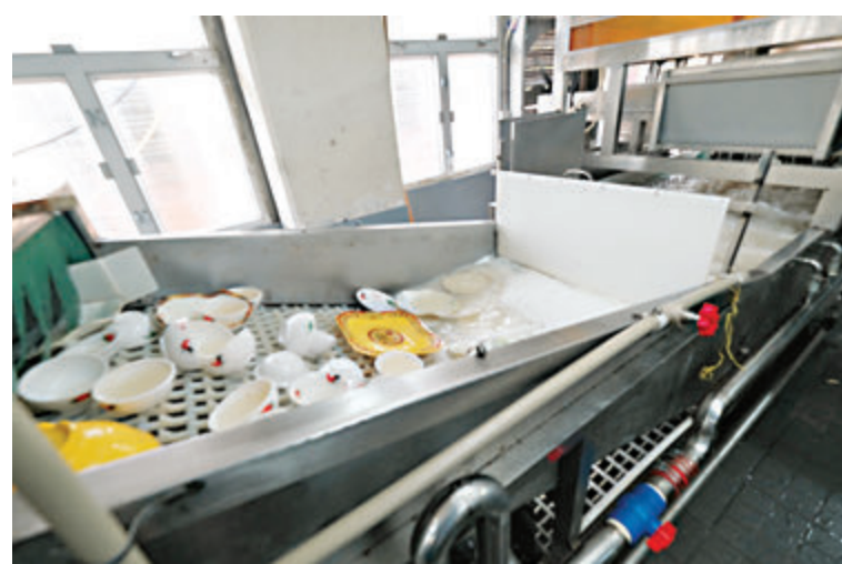
●飲食界認為，洗碗工場清潔出來的碗碟乾淨程度具有穩定性。