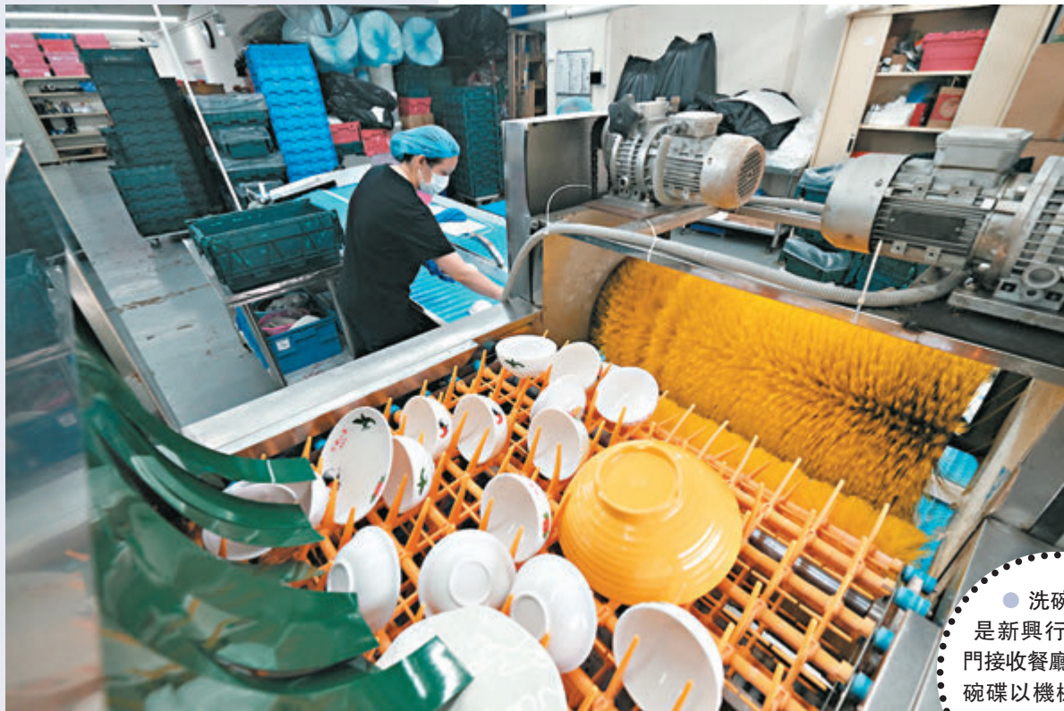
●洗碗工場是新興行業，專門接收餐廳、食肆的碗碟以機械清洗乾淨。