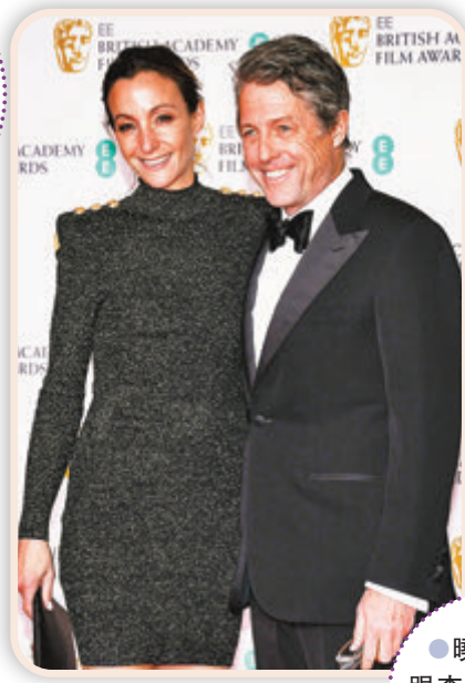
●曉格蘭特跟李安是電影老拍檔。