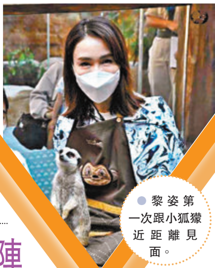
●黎姿第一次跟小狐獴近距離見面。

香港文匯報訊(記者阿祖)黎姿日前帶著爸媽、弟弟和三個女兒結伴重遊香港海洋公園,獲得的是滿滿的幸福感。黎姿特別去玩最愛玩的過山車並笑說:「無論是小時候或現在,刺激的機動遊戲是我又怕又最想玩的。過山車是每次必玩,由緊張的尖叫到放鬆地笑不停,短短幾分鐘的確能經歷有如過山車般起伏的心情。」 黎姿又表示第一次跟小狐獴近距離見面,3小豬(女兒)和她馬上被超可愛的模樣融化掉。她又謝謝香港海洋公園讓她們化身護理員餵飼小狐獴,了解到小動物們的日常生活。她說:「愈是認識大自然的奧妙,愈是明白到我們需要好好珍惜和愛護自然生態,讓一切生物得以在健康環境下生長。想提高小朋友的保育意識,帶他們親身體驗最有效用。」而今次家庭樂亦成了親子活動,能夠讓黎姿滿載成長的快樂回憶,她感到滿滿的幸福感,也覺得任何年紀都能在這主題公園找到樂趣,是適合家庭樂的好地方。