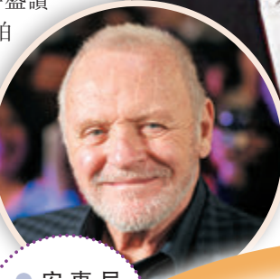
●安東尼鶴健士的演技不容懷疑。

憑演出《Judas and the Black Messiah》奪最佳男配角,韓國女星尹汝貞憑演出《農情家園》獲最佳女配角。 台灣導演李安獲頒終身成就獎,由英國知名影星曉格蘭特介紹出場,兩人曾在1995年電影《理智與情感》(Sense and Sensibility)有過合作。曉格蘭特盛讚李安電影創作類型豐富,很難想像一個人能拍出所有這些電影,更幽默稱懷疑李安有複製人。他表示:「今晚最經典的獎要頒給應該是世界影壇最經典的導演,以及我本人可以作證,最經典、偉大的李安。」 李安透過視像回應道:「在《理智與情感》後,我更敢去冒險拍攝多樣類型的電影,賦予我勇氣去擴展視野,敞開心胸。對我而言,這就是電影的真諦,有勇氣敞開自我去面對真相,透過故事、景象與聲音呈現在大銀幕上,這是我與世界建立連結的方式,也是我熱愛的事。」