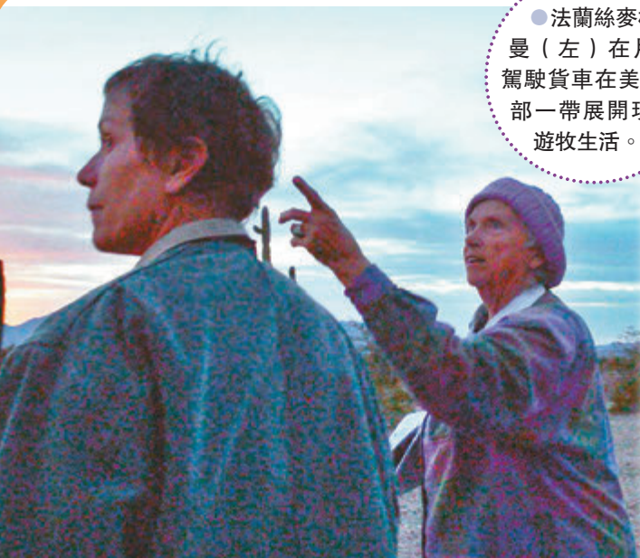
●法蘭絲麥杜曼(左)在片中駕駛貨車在美國西部一帶展開現代游牧生活。