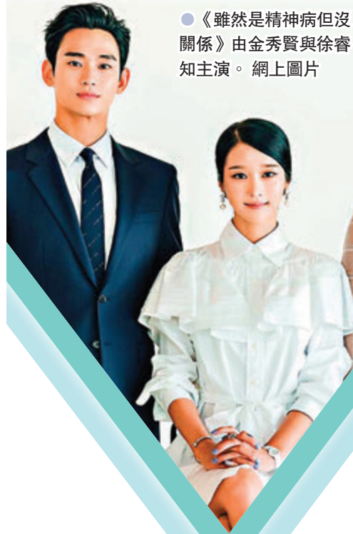
●《雖然是精神病但沒關係》由金秀賢與徐睿知主演。網上圖片