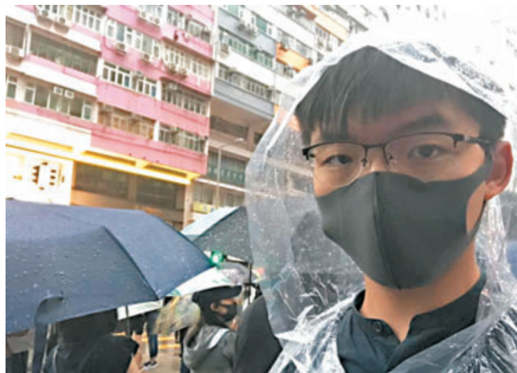
●圖為當日黃之鋒戴上口罩參與未經批准的遊行。資料圖片