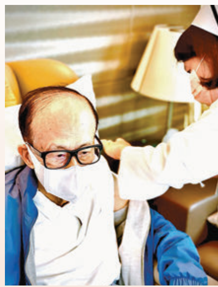
●李嘉誠昨日接種新冠疫苗。

負責統籌香港疫苗接種計劃的公務員事務局局長聶德權隨後轉發該帖文，並感謝李嘉誠身體力行支持疫苗接種計劃。他表示，香港要建立保護屏障，重啟經濟，恢復出行，讓大家重回正常生活，一定要靠社會各界同心支持，盡早接種疫苗，「疫苗接種計劃要能成功，您的參與、支持，絕對不能少！」