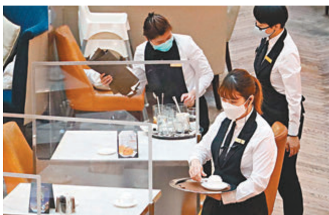
●黃家和昨透露，政府正設計一張申報表，讓因身體狀況等原因未能接種的食肆員工透過申報以豁免接種。圖為食肆員工戴口罩工作。

平機會主席朱敏健表示，近兩日接獲十多宗有關僱主要求接種疫苗的查詢，但未有正式投訴。他認為，接種疫苗後可獲更好待遇，但不接種不應有較差待遇，若有員工因拒絕接種疫苗而被解僱，有可能觸犯《殘疾歧視條例》中的間接歧視，故會按具體情況處理每宗投訴。至於政府建議的「疫苗氣泡」造成的待遇差別，是合理及有需要的，措施本身可豁免受歧視條例監管。