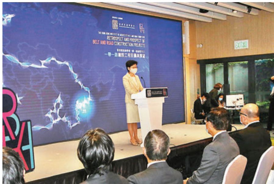
●林鄭月娥出席建築師學會一帶一路論壇致辭時表明，「疫苗氣泡」是防疫工作的新方向。

行政長官林鄭月娥昨日在出席建築師學會一帶一路論壇致辭時表明，「疫苗氣泡」是防疫工作的新方向，疫苗接種計劃正在進行，計及私人診所，有逾千個地點讓30歲及以上居民接種疫苗，接種門檻也很快放寬至16歲或以上市民，目前最需要做的是加快疫苗接種的速度，並呼籲市民盡快接種。