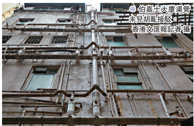
● 伯嘉士大廈渠管未見胡亂接駁。