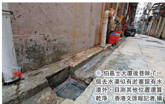
● 伯嘉士大廈後巷除了一個去水渠似有淤塞留有水漬外，目測其他位置還算乾淨。

若女患者才是源頭，即意味變種病毒已流入本港社區潛伏，隨時引發第五波社區爆發的危機，他認為當務之急是盡快追查患者的行蹤，必要時佐敦等區域要再採取封區強檢行動，希望在病毒未擴散前能及時切斷傳播鏈。