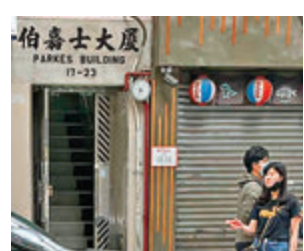
● 伯嘉士大廈外有人除罩煲煙。

特區政府今次將「疫廈」居民火速送檢，行動果斷，使居民安心不少。這一區劊房林立，很多大廈沒有住戶名單難以追蹤，加上劊房面積小、居民多接觸，政府及時圍封並撤離居民，能有效防止有風險個案走漏。