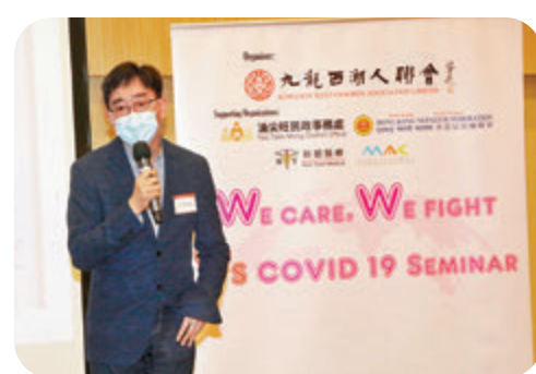
●高永文擔任此次健康講座的主講嘉賓。

另外，高永文在接受大公文匯全體媒體記者專訪時表示，疫苗是有效的防疫手段，認為香港要向其他地方展示已經盡力且有效地控制了疫情，令其他地方有信心與香港恢復通關(專訪內容可掃碼觀看)。