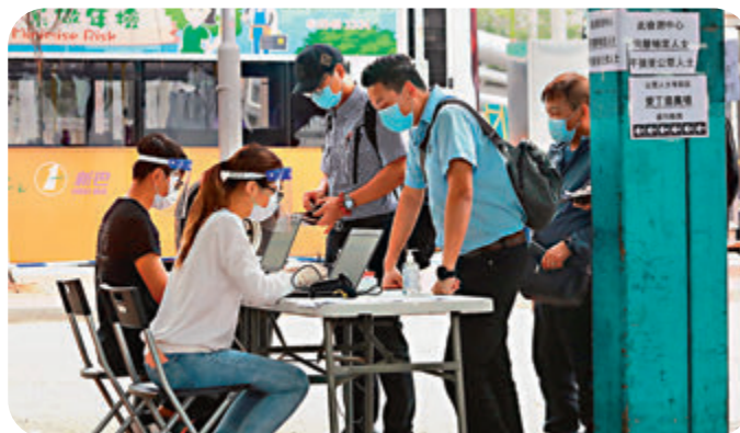
◀中環碼頭外設置流動採樣車，供新渡輪員工做強制檢測。