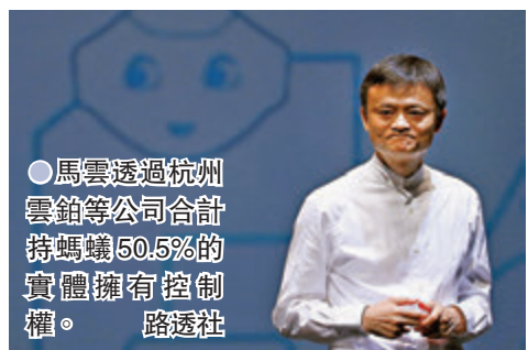
●馬雲透過杭州雲鎔等公司合計持螞蟻50.5%的實體擁有控制權。路透社

香港文匯報訊（記者 周紹基）阿里巴巴（9988）旗下螞蟻集團自去年上市觸礁後，進行多項金融業務整改。外電引述消息人士稱，內地監管部門今年初曾與螞蟻創辦人馬雲舉行多次會議，探討馬雲出售螞蟻股份並放棄集團控制權的方案，但目前未有最終決議。路透社消息指，螞蟻正研究讓馬雲出售股權及交出控制權的各種方案，並引述一名熟悉內地監管機構想法和兩名與螞蟻關係密切的消息人士指，人民銀行和銀監官員在1月至3月分別會見馬雲和螞蟻，討論馬雲退出集團