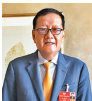
●劉長樂旗下今日亞洲將分別向紫荊文化(香港)集團和信德集團出售鳳凰衛視股份。資料圖片

香港文匯報訊（記者 周紹基）鳳凰衛視(2008)昨日宣布，獲主席兼大股東劉長樂旗下今日亞洲於4月17日告知，其與紫荊文化(香港)集團和信德集團(0242)全資附屬公司Common Sense分別簽署框架協議，將有條件出售共18.94億股公司股份，約佔該公司已發行股本37.93%，總代價為11.56億元。交易完成後，今日亞洲幾乎沽清所有鳳凰股份。