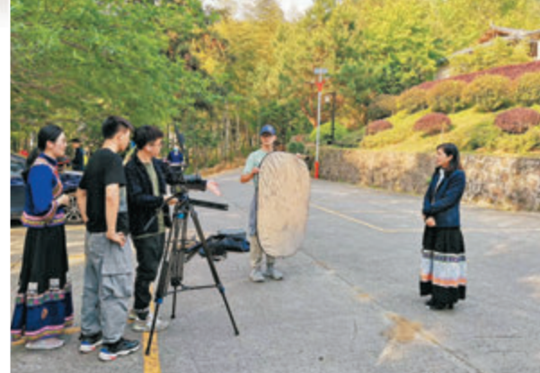
● 刁怡峰團隊在連山為時任縣長馮紅雲拍攝短視頻。右一為「網紅縣長」馮紅雲。