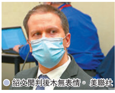
● 紹文聞判後木無表情。