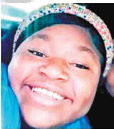
● 被警員射殺女童布萊恩

46歲的弗洛伊德在明尼阿波利斯被捕過程中，遭紹文以膝頭跪壓頸部長達9分29秒，其間他27次呼喊「我無法呼吸」，隨後死亡。經過長達3星期的審訊，45名證人先後出庭作供，由6名白人、4名黑人和2名混血人士組成的12人陪審團，商議約10小時後，一致裁定紹文被控的各項二級謀殺、三級謀殺及二級誤殺罪名全部成立。陪審團判決之快以至判決結果，都稱為超出外界預期，由於美國過往鮮有警員因執勤期間殺人被判罪，不少專家原本估計，紹文的二級謀殺甚至三級謀殺罪皆有可能不成立。