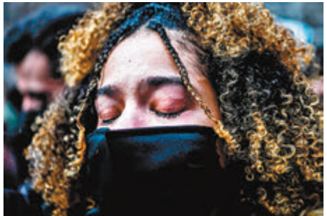
● 民眾感動落淚。