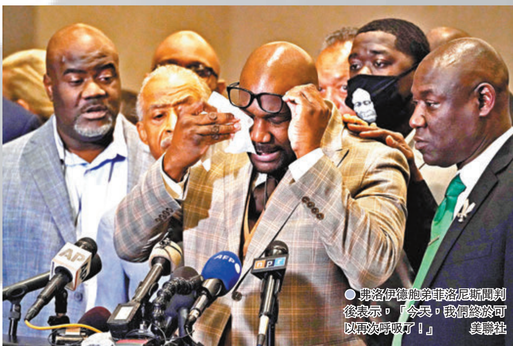
● 弗洛伊德胞弟菲洛尼斯聞判後表示，「今天，我們終於可以再次呼吸了！」