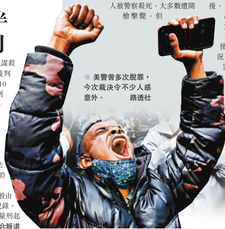
● 美警曾多次脫罪，今次判決令不少人感到意外。