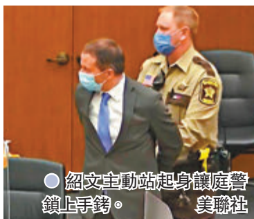
● 紹文主動站起身讓庭警鎖上手銬。