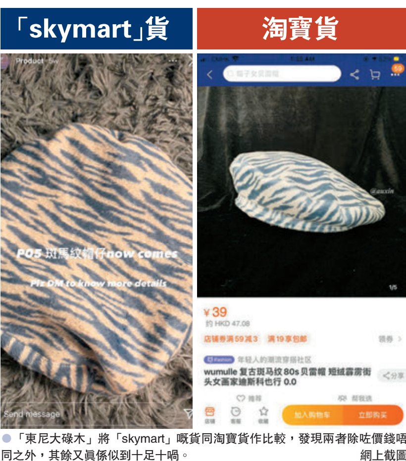
●「東尼大碌木」將「skymart」嘅貨同淘寶貨作比較，發現兩者除咗價錢唔同之外，其餘又真係似到十足十。

今時今日嘅「黃店」呢「同路人」嘅手段真係花式翻新，但相信班淨係識得分顏色嘅「蠢黃」都依然會懶理事實，繼續盲撐俾人兜落去。 ●香港文匯報記者 倪思言