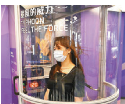
●參觀的市民可以體驗颱風威力。

香港文匯報訊(記者黃恆諾)氣候變化令極端天氣變得常見,科學館今日開放全新的常設展覽「地球科學廳」,參觀市民除了可以了解颱風過去曾對香港造成哪些破壞外,亦能進入「颱風模擬室」感受大自然的威力。科學館總館長陳淑文期望市民可以透過展覽了解珍惜和保護大自然的重要性。