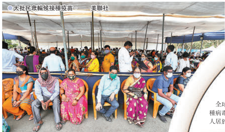
●大批民眾輪候接種疫苗。