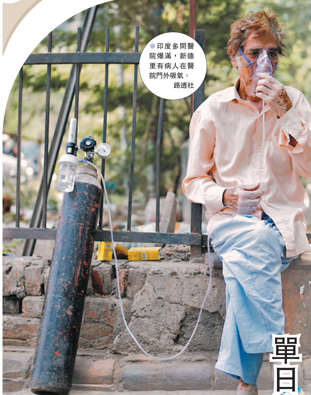
●印度多間醫院爆滿，新德里有病人醫院門外吸氧。