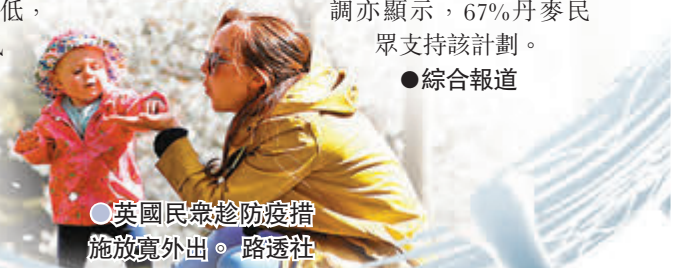
●英國民眾趁防疫設施放寬外出。