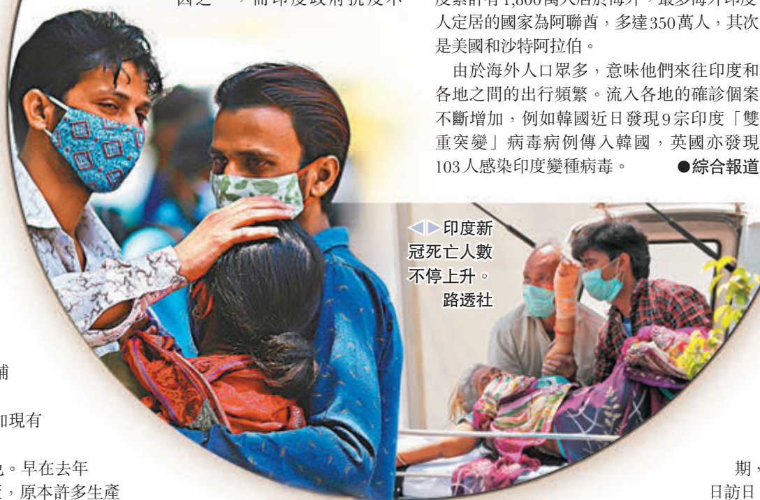
◀印度新冠死亡人數不停上升。