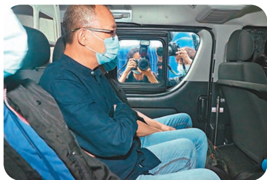
●去年11月21日，傑斯被香港警務處國家安全處人員拘捕後押返北角警署調查。資料圖片

香港文匯報訊(記者 蕭景源)香港國安法實施後，警方多次依法對「播揚煽暴」網站展開「封網」行動。繼今年1月封鎖「起底」的