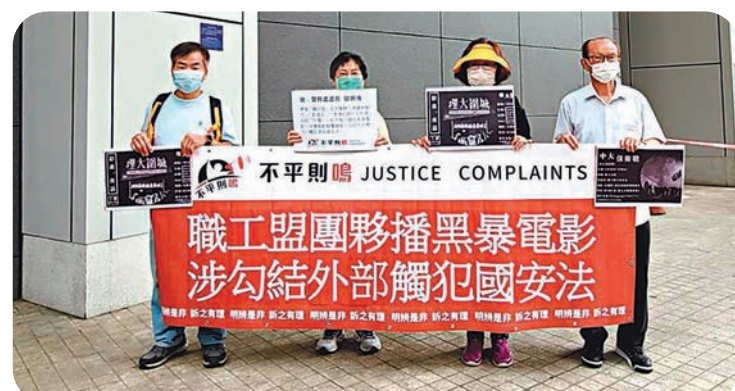
●網民組織「不平則鳴」昨日到警察總部舉報職工盟及其團夥播放黑暴電影。