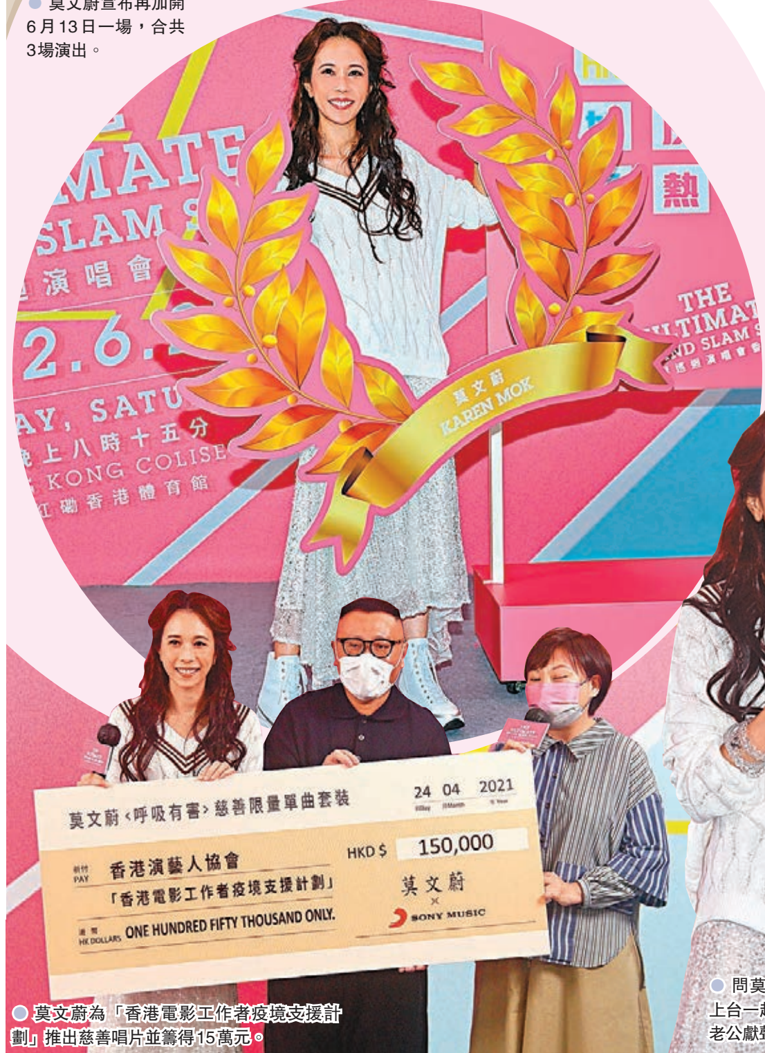
●莫文蔚為「香港電影工作者疫境支援計劃」推出慈善唱片並籌得15萬元。