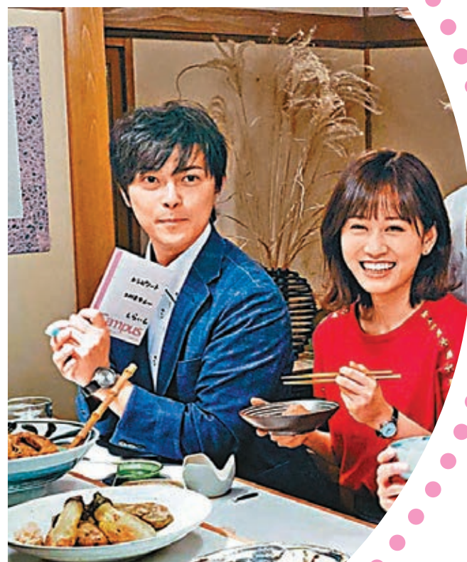
●2018年,前田敦子下嫁交往不到半年的勝地涼。網上圖片

另外,有日媒報道指前田敦子近日離開合作13年的經理人公司,她現在看似持續在電視劇、電影露臉,但這些工作全是前東家時期接到的。她現獨立出來開公司,又變成單親媽媽獨力養小孩,未來的路更為艱難。