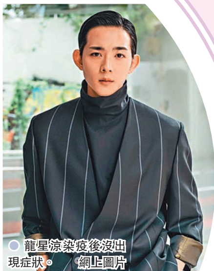
●龍星涼染疫後沒出現症狀。

據知,龍星涼在本月15日出席品牌活動,同台的還有天海祐希,雖然兩人在台上保持一定距離,但仍有網友擔心,認為當日跟龍星涼同場的人也需要進行檢測。