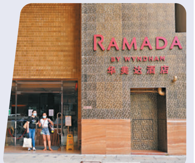
●政府要求所有海外抵港人士在檢疫期第七天接受檢測。圖為檢疫酒店尖沙咀華美達華麗酒店。