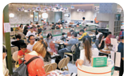
●張宇人指,政府擬推「疫苗氣泡」,有望放寬食肆防疫規定。圖為一食肆。

香港文匯報訊(記者 文森)特區政府提出「疫苗氣泡」,以接種疫苗作為基礎,逐步放寬食肆及處所的防疫規定。立法會飲食界議員張宇人昨日透露,如果疫情沒惡化,計劃有望本周四推行,如員工因身體不適打針,可毋須提交醫生證明,只要填寫不適直接接種