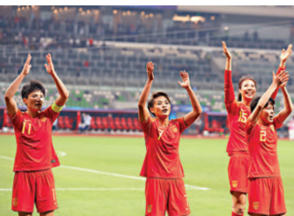
國家女足奧運比賽地點公布。新華社

東京奧運會女足比賽共有12支球隊參加，分三組進行小組賽。根據規則，每個小組的前兩名以及兩個成績最好的第三名晉級淘汰賽。這是國家隊第6次參加奧運會女足比賽，是亞洲參加奧運會次數最多的女足隊伍。自1996年女足成為奧運會正式比賽項目以來，國家隊僅缺席了2012年倫敦奧運會。 ●新華社