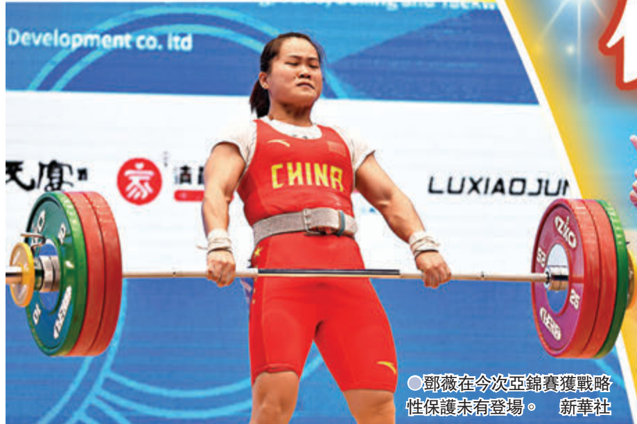
鄧薇在今屆亞錦賽獲戰略性保護未有登場。新華社