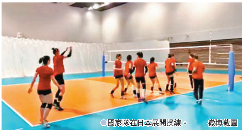
國家隊在日本展開操練。

國家隊的人員每天需要按照事先確定的行程活動，一日三餐和訓練的時間都要提前安排好。在約定的時間，會有專人負責為國家隊開電梯，那段時間有一部電梯專門由國家隊使用。除了用餐、訓練等集體行動之外，國家隊的人員不能離開所在樓層，也不能接受客人的來訪。組委會特意提醒國家隊，不能接待訪客。萬一有外人混上了國家隊居住的樓層，測試賽將面臨被取消的風險。