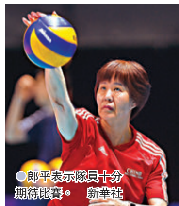
郎平表示隊員十分期待比賽。

抵達日本之後，中國女排已經在主教練郎平的率領下開始了正常訓練，26日和27日的場地訓練都在訓練館進行。26日，除了場地訓練之外，中國隊還在所在酒店的健身房進行了身體訓練。在