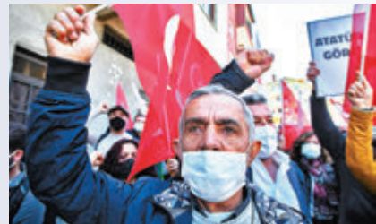
●土耳其民眾示威反對美國決定。新華社