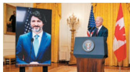
●拜登與杜魯多舉行視像會面。