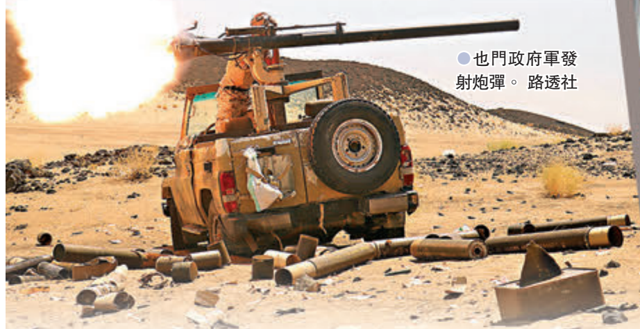
●也門政府軍發射炮彈。