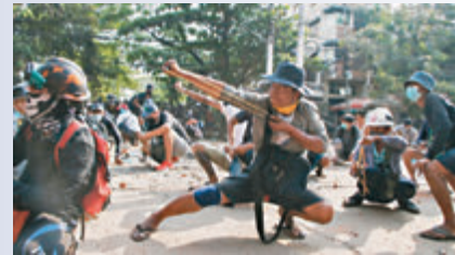
●緬甸爆發大規模示威。