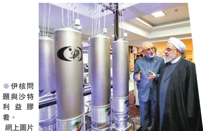
●伊核問題與沙特利益膠着。

美國總統拜登的競選承諾之一，是要重塑美國在國際社會的領導地位，亦即放棄前朝政府的「美國優先」主義，修補與盟友關係、參與國際事務；與此同時，拜登亦提出外交政策要服務國內中產的利益，打造「為中產而設的外交政策」。不過專家提醒，拜登兩項外交主義在不同議題上都存在矛盾，不可能貪心地將兩者皆列為優先，拜登政府必須學會減少或放棄涉足每一項國際議題，學懂「管治即抉擇」。