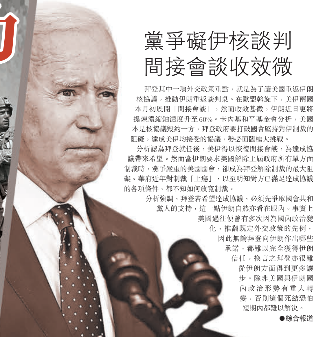
●拜登下令撤軍，結束美國最長戰爭。