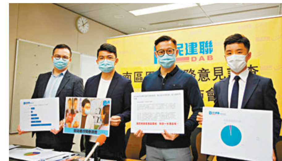
● 民建聯建議改善巴士票價可加可減機制，應參考港鐵引入巴士延誤罰款機制等，並反對巴士公司計劃大幅縮減服務。

香港文匯報訊 民建聯南區支部昨日公布於4月份進行的一項調查顯示，以0分為最不满意，10分為非常满意，800名受訪者中接近一半對南區巴士服務給予5分或以下，反映南區居民對區內巴士服務的不滿。民建聯建議改善巴士票價可加可減機制，並反對巴士公司計劃大幅縮減服務。