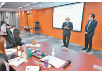
● 張建宗(右二)與正參加「公共行政領袖實踐課程」的學員交流，了解他們的學習情況。

張建宗：增基本法培訓助公僕識國安 香港文匯報訊 政務司司長張建宗昨日視察公務員培訓處，了解培訓處推動公務員參與國家事務培訓、發展網上平台「公務員易學網」的情況，以及公務員學院的籌備進展。