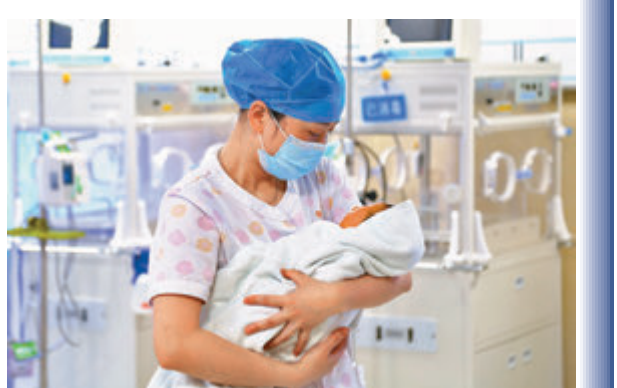
●有學者指出，疫情下結婚和生育活動都受到抑制。圖為貴州省某醫院護士在照料初生嬰兒。 資料圖片

也有不少學者提出，應對人口問題不應該停留在鼓勵生育的層面，更應討論產業轉型適應新的人口結構。 ●中通社