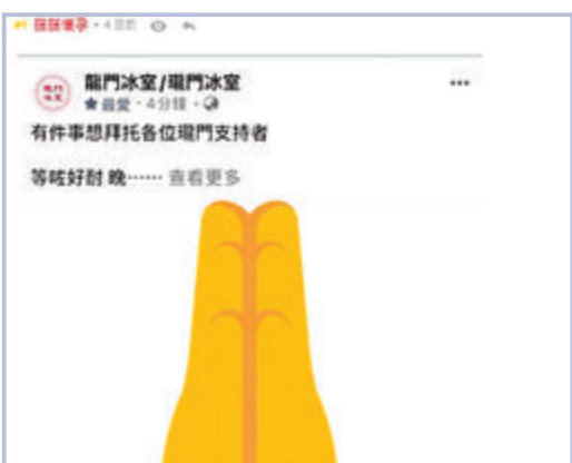
●「連登」帖主近日回帶「龍門」告急帖文，俾網民大罵炒冷飯。