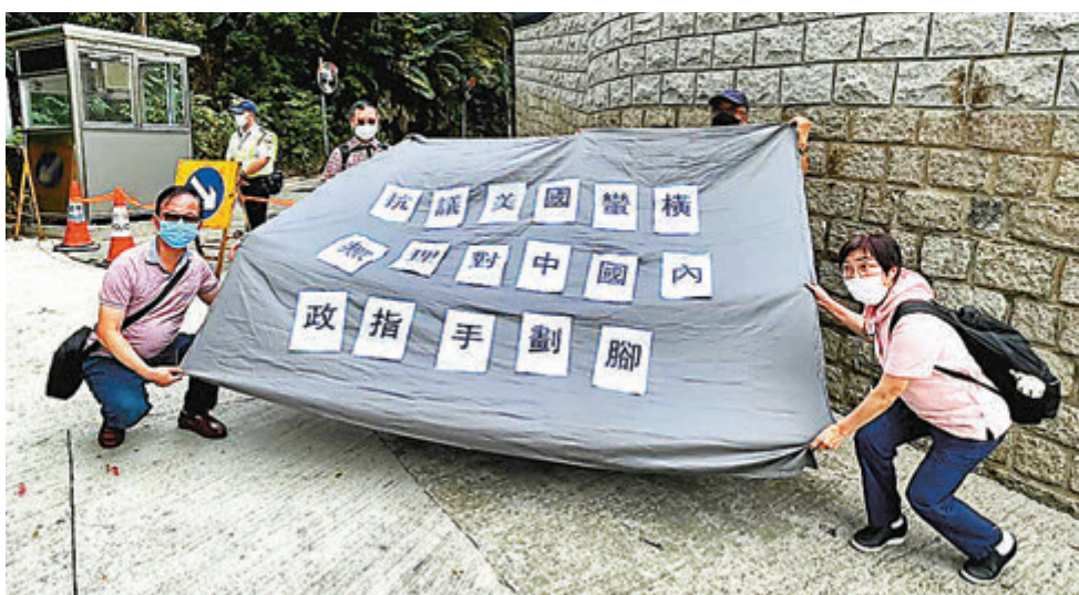
●市民到美國駐港總領館請願，抗議美國干涉香港事務。