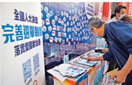
●香港市民簽名支持完善選舉制度。資料圖片

他並指，新選舉制度下會形成新的管治形態，即「中央+特區政府+愛國力量」，「這將會是前所未有的龐大管治力量，能夠推動香港各方面的改革。」他推斷，中央會採取新的治港方向，希望短期內通過改革和配套，包括香港國安法、國民教育、改革傳媒等，徹底改變香港過去20多年來，甚至是更長時間的亂局。