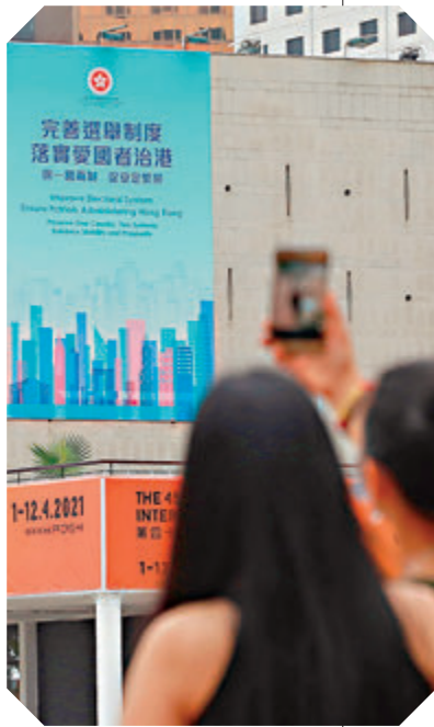
●市民用手機拍攝「完善選舉制度」宣傳海報。資料圖片

不少反對派在面臨控罪時選擇潛逃海外、沽售物業、在法庭上求情，劉兆佳直言，沒有人能夠表現出硬骨頭的氣概，更與他們以前聲言不怕犧牲的精神背道而馳，「很多反對派到關鍵時刻表現出來的軟弱、立場不穩、缺乏道德、勇氣和政治膽識，都令他們的支持者很失望，「疾風知勁草」，但他們並非「勁草」，甚至連外部勢力都對他們感到失望。