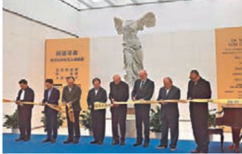
●嘉賓為油畫展剪綵

1940年出生於浙江寧波。自幼酷愛美術。1956年考入中央美術學院華東分院附中，1964年畢業於浙江美術學院。1978年考入浙江美術學院油畫系研究生班學習，1983年選派赴比利時根特皇家美術學院學習。曾在比利時根特、布魯日、安特衛普和德國巴特薩朱倫舉辦個展。1986年回國後一直任教於浙江美術學院(即中國美術學院)油畫系，曾任該系主任。作品在美國、日本、意大利、比利時等國展覽。1993年獲文化部「優秀藝術家」稱號。