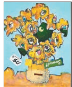
●劉建文作品《高尚的思想》