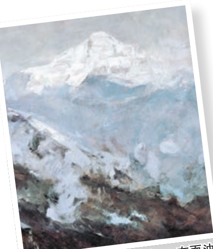
●趙友萍《正氣天聲》，布面油畫，120x120cm，2017年作