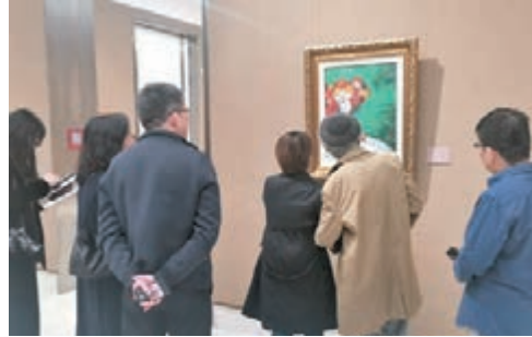
●沙耨作品備受關注