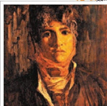
●胡振宇《弗拉蒙少女》，布面油畫，65x65cm，1984年作