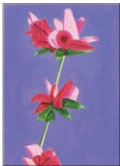
●亞歷克斯·卡茨作品《淡紫色之上的杜鵑》

的畫風，米歇爾更希望自己的作品能夠描繪出獨有的風格和故事。《3點鐘的12隻鷹》就將一種靜謐的氛圍以及藝術家眼前的時空定格在畫布當中。展覽中還展出了喬納斯·伍德九幅油畫的作品精選，它們屬於一組形式實驗性作品，剛開始藝術家將它命名為「新植物」。喬納斯·伍德的作品顯然受到藝術家亞歷山大·考爾德雕塑的影響，觀眾能感受到伍德大膽運用色塊的搭配、平坦的繪畫手法構成了常青植物構想的矚目陣列。而藝術家艾米·希爾曼的三件紙本繪畫作品也在同場展出。希爾曼的態勢作品從容而精準，佔據了介於具象和抽象、風景和肖像之間的領域。