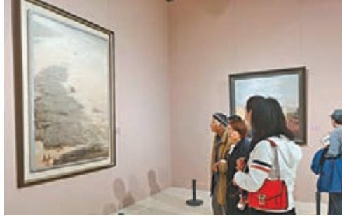
●眾多美術界人士來觀展