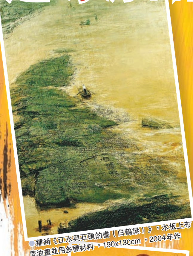
●鍾涵《江水與石頭的書(白鶴梁)》，木板正布底油畫並用多種材料，190x130cm，2004年作