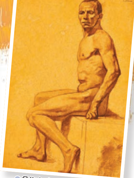
●吳作人《男人體》，素描，紙質炭筆 76x51cm，1933年作