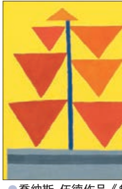
●喬納斯·伍德作品《無題》