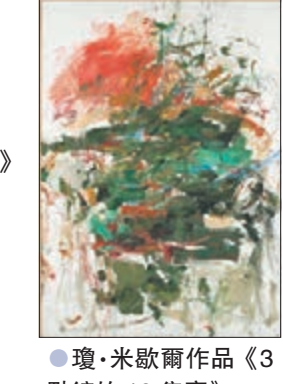
●瓊·米歇爾作品《3點鐘的12隻鷹》