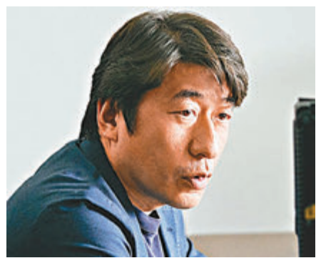
電影《奇蹟的燒肉店》導演寺門Jimon。

在電影裏，寺門Jimon在故事中藉着男女主角對燒肉的執着，給電影的氣氛添上陣陣的喜感，卻同時也刻畫了男主角對母親的情感和抱憾，在尋尋覓覓的過程中，一點一點給男主角拆解心結，並通過燒肉道出更多人情冷暖的插曲。電影除帶出了食物的甜酸