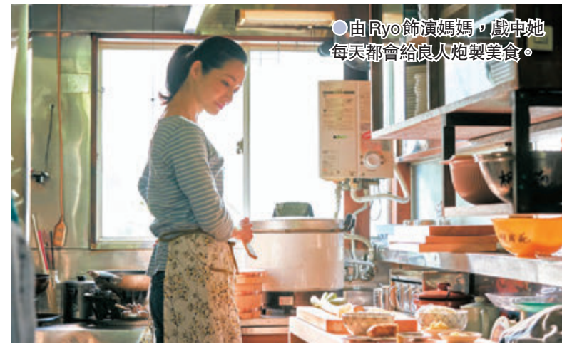
由Ryo飾演的媽媽，戲中她每天都會給良人炮製美食。