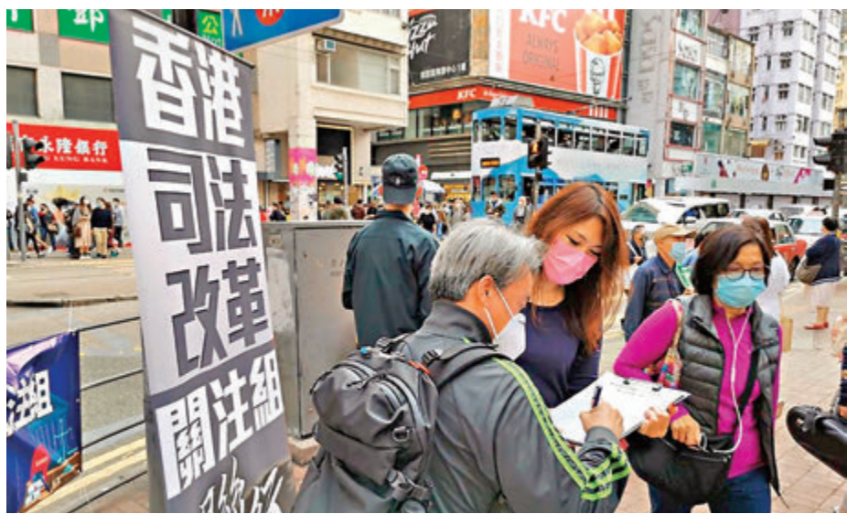
●圖為市民聯署支持司法改革。