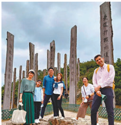
●梁詠琪一家三口聯同弟弟、弟婦跟媽媽在心經簡林留影。

Gigi指母親節快到,也介紹大家可以到大嶼山的心經簡林走走,不失為假日好去處。之前她一家人趁着平日人煙稀少,而且還是微涼的初夏到郊外踏青,呼吸下新鮮空氣,身心舒暢。Gigi表示看見以往人來人往的景點因疫情關係變得非常清靜,雖然感到唏噓,但亦因此令他們多了機會和空間周圍看看,重新認識這片土地。