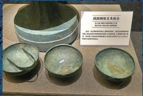
●戰國銅俎豆夾組合

的餐具組合，俎的用途很廣泛，既是直接載牲的盛食器，也是盛放各種器皿的承托器；豆是盛食器，主要盛放肉醬、醃菜等食物，夾是取食物的餐具。這套組合體現了巴人上層社會的餐飲習俗和祭祀禮儀。