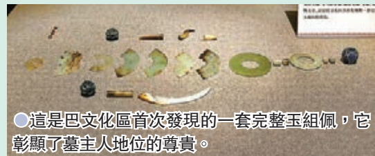
●這是巴文化區首次發現的一套完整玉組佩，它彰顯了墓主人地位的尊貴。