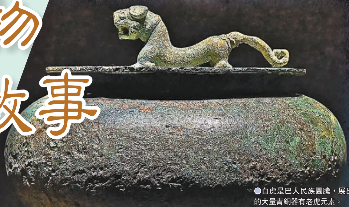
●白虎是巴民族圖騰，展出的大量青銅器有老虎元素。

占卜是古代的一種巫術行為，上至王公貴族下至平民百姓都好此道，在流傳的巴地民謠《長生》中，充滿巫文化的神秘韻味——「日月明明，亦惟其明。誰能長生，不朽難獲。」但與中原地區不同，巴人使用的甲骨中，以魚鱗骨居多，且尚未見如殷墟那有卜辭者。