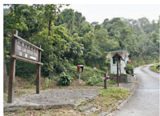
●梁振英建議，用百分之二的郊野公園邊陲地帶興建3萬個房屋單位。圖為大嶼郊野公園。資料圖片

梁振英認為，香港現時私人住宅的樓價和租金已經遠遠超出一般家庭的負擔能力，很多調查都顯示，香港在住宅、房屋不能負擔的情況是全世界最嚴重，在這種情況下，已不能通過市場價格租金來滿足一般家庭住屋需要。正如當年興建第一座石硤尾公屋時，政府需要介入，但並非要取代地產商的角色，取代私人住宅單位供應，而是滿足地產商不能滿足、有住屋需求的一大群人。