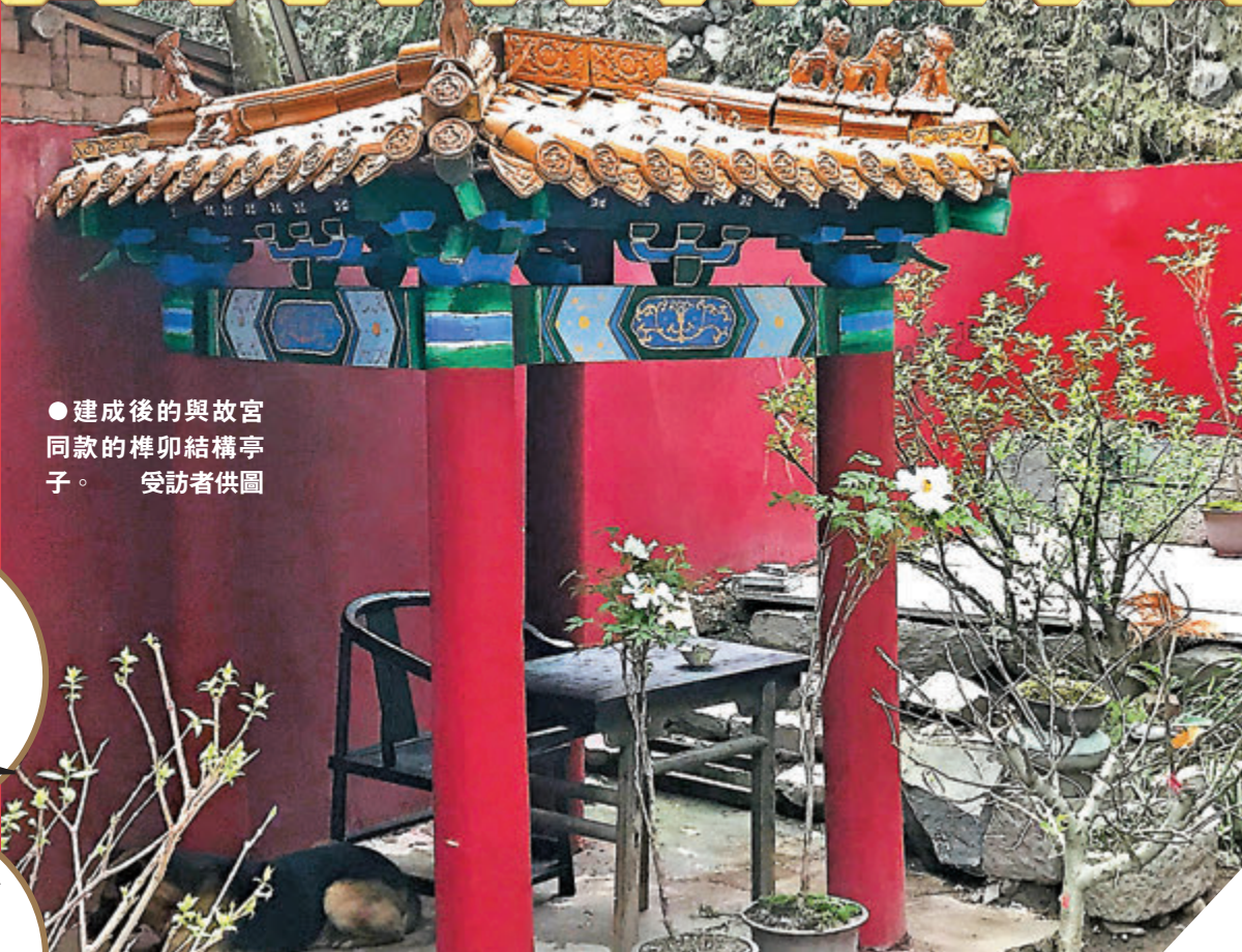
●建成後的與故宮同款的榫卯結構亭子。

榫卯是在兩個木構件上所採用的一種凹凸結合的連接方式，凸出部分叫榫（或榫頭），凹進部分叫卯（或榫眼、榫槽）。最基本的榫卯結構由兩個構件組成，其中一個榫頭插入另一個卯眼中，使兩個構件連接並固定。榫卯結構是中國古代建築、傢具及其它木製器械的主要結構方式，是木件之間多與少、高與低、長與短之間的巧妙組合，可有效地限制木件向各個方向的扭動。 榫卯是極為精巧的發明，這種構件連接方式，使得中國傳統的木結構成為超越了當代建築排架、框架或者鋼架的特殊柔性結構體，不但可以承受較大的荷載，而且允許產生一定的變形，在地震荷載下通過變形抵消一定的地震能量，減小結構的地震響應。 1973年，距今六七千年的新石器文化遺址——浙江余姚河姆渡遺址中就發現了大量榫卯結構的木質構件。這些榫卯結構主要應用在干欄式的房屋的建造上，有凸型方榫、圓榫、雙層凸榫、燕尾榫以及企口榫等。