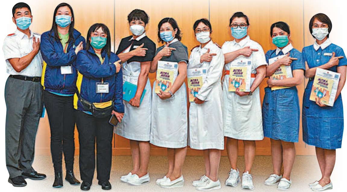
● 一群醫護人員在中央圖書館接種疫苗後，呼籲同業和市民及早接種疫苗。