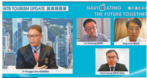
● 旅發局昨日舉行網上旅遊業簡報會。

另外，上海自5月16日零時起，對新入境境外(含港澳台)人員實施14天隔離觀察後，還需7天社區健康監測。在隔離和監測期間至少進行6次核酸檢測。