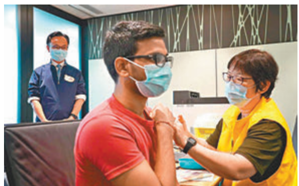
▲ 外展隊首次出動為德勤會計師事務所職員接種疫苗。公務員事務局局長聶德權(上圖左)到場了解。