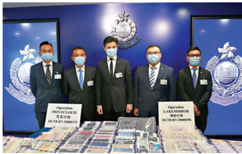
●警方展示檢獲的現金及手提電話等證物。