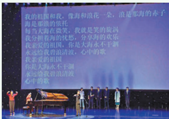
● 郎朗與李澤森合奏《我和我的祖國》

這活動正是國家在大力培養複合型人才的背景下，清華大學藝術教育中心與眾多單位共同主辦的《音符、數字和沙粒的微小與宏大》藝術與科學系列對話沙龍，著名數學家丘成桐與清華大學強基計劃的致理、日新、未央、探微、行健