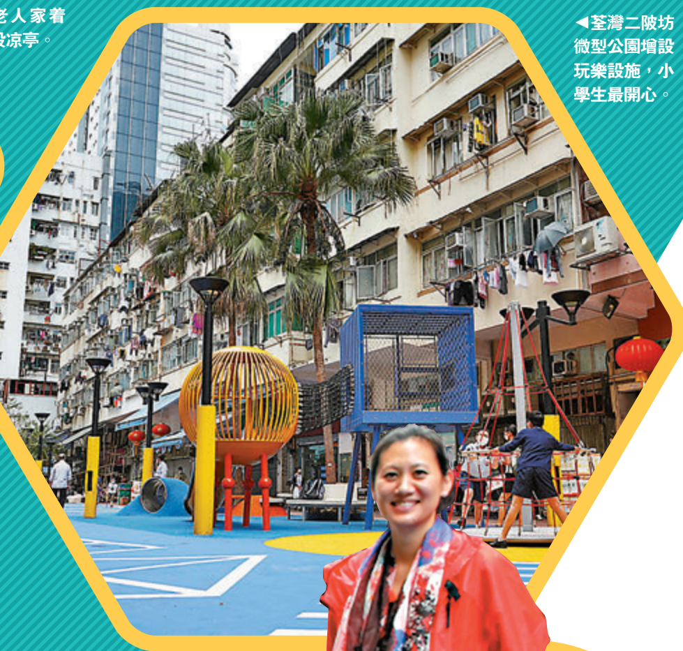
◀ 荃灣二陂坊微型公園增設玩樂設施，小學生最開心。