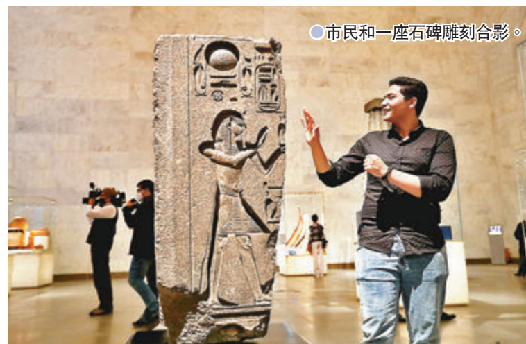
● 市民和一座石碑雕刻合影。