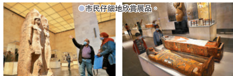
● 市民仔細地欣賞展品。