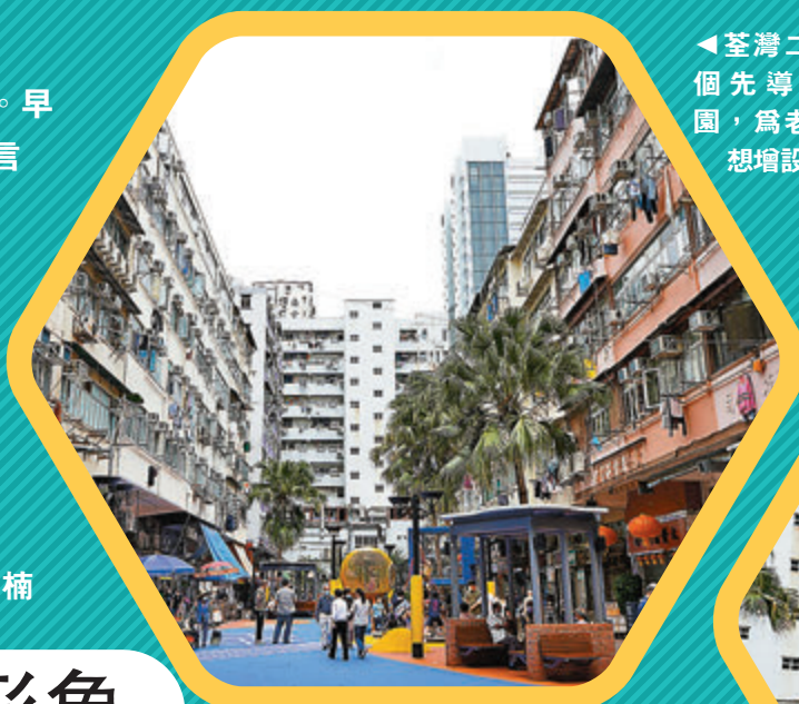
◀ 荃灣二陂坊首個先導微型公園，為老人家着想增設涼亭。