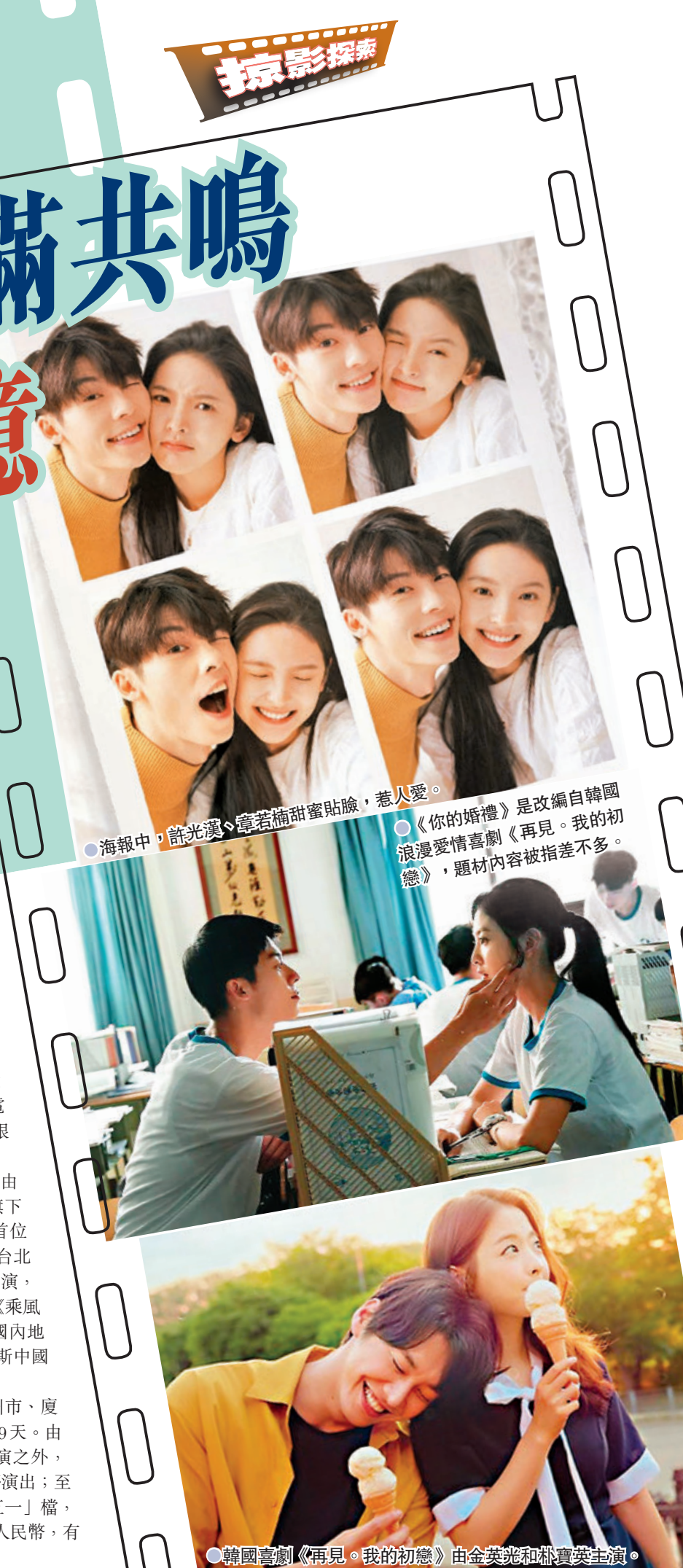
●海報中，許光漢、章若楠甜蜜貼臉，惹人愛。 ●《你的婚禮》是改編自韓國浪漫愛情喜劇《再見，我的初戀》，題材內容被指差不多。