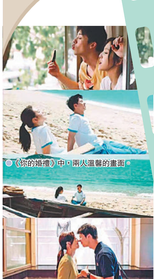
●《你的婚禮》中，兩人溫馨的畫面。