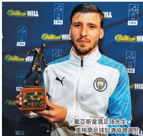
●戴亞斯當選足球先生。