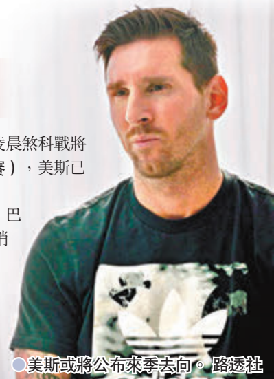
●美斯或將公布來季去向。

另外據西班牙《每日體育報》報道，巴塞教練朗奴高文來季留隊的機會甚高，消息指巴塞至今尚未找到高文的替代者，加上這位荷蘭教頭有着高達750萬歐元的合約，令巴塞高層望而卻步。在這情況下，高文亦開始為來季制定計劃，並已向高層開出心水轉會名單。