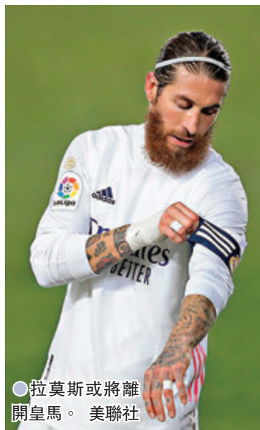
●拉莫斯或將離開皇馬。

這支「黑馬」今季已殺入歐霸盃決賽，近兩場亦顯示出強大攻力，加上要為來季歐洲賽資格而戰，不會將3分輕易拱手相讓。皇馬要勝出今仗必須踢出百分百的水準，不過縱然皇馬能夠如願稱王，球隊來季仍免不了面臨一次大換血，有指主帥施丹已經決定離隊，加上卻奧斯及莫迪歷等老将亦急需新人接班，令皇馬更希望以一個聯賽冠軍作為換血期的起點。