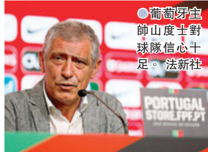
●葡萄牙主帥山度士對球隊信心十足。

葡萄牙在今屆歐國盃被編入F組死亡之組，球隊將於6月15日對陣匈牙利，並於19日和23日對戰德國和法國，主帥山度士接受訪問時，則似乎對晉級仍是信心十足，揚言葡萄牙仍是冠軍競爭者。