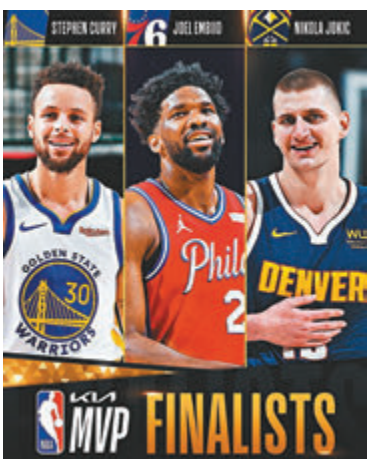
●(左起)居里、艾比迪和祖基奇將競逐年度MVP。

居里本季拿下得分王，還創下勇士得分的隊史紀錄。他是米高佐敦以每戰平均32分成為得分王後，拿下得分王最年長的球