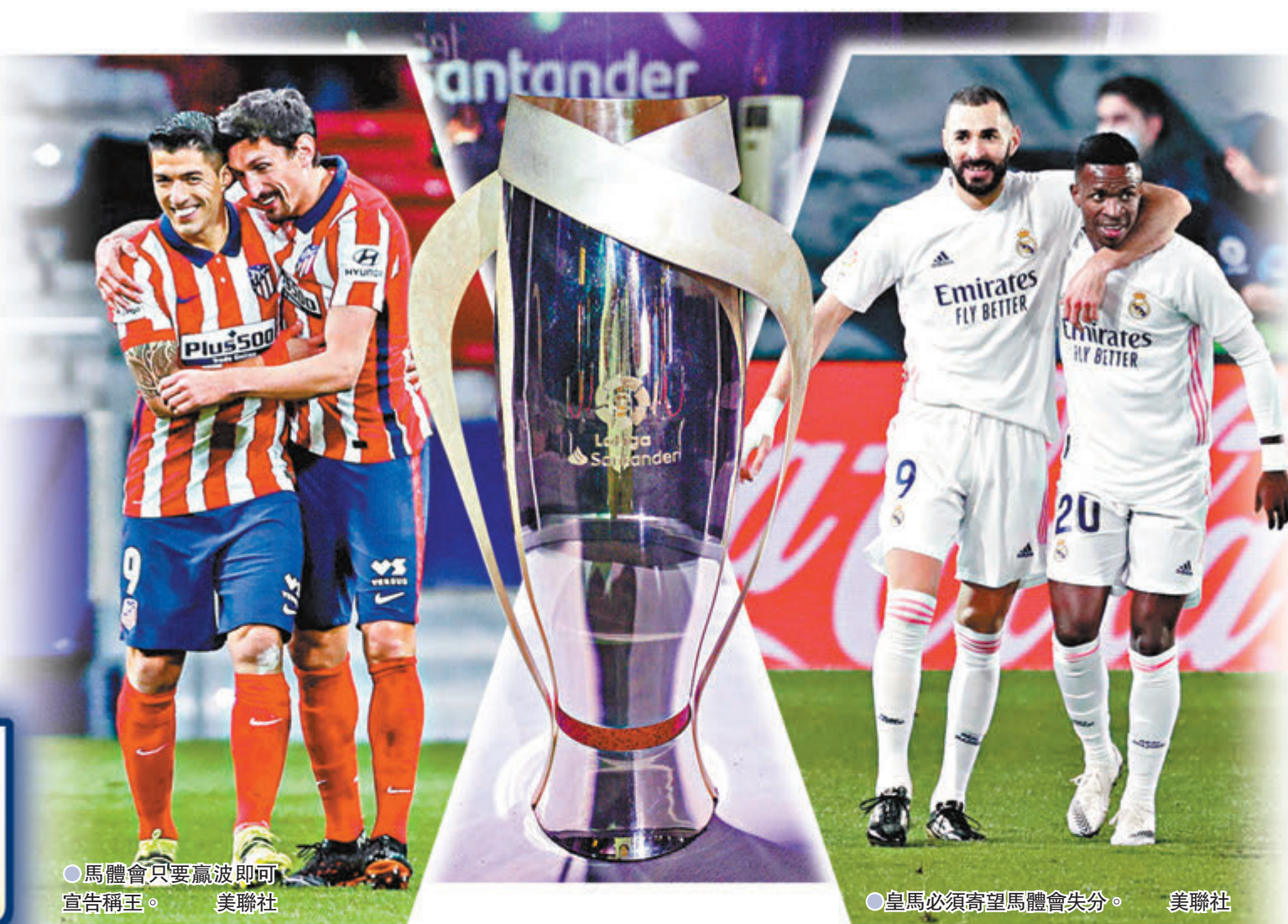
●馬體會只要贏波即可宣告稱王。