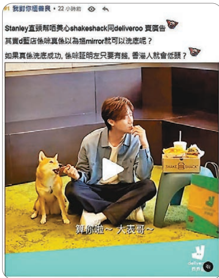
●「Mirror」成員代言美心同Deliveroo。連登截圖

為咗說服自己，有連登仔更出咗數千字嘅長文幫mirror嘅fans解畫，要反思「黃圈」嘅定義，仲得出「佢只要一日唔係幫『極權』宣傳咩思想，我一日都唔需要當佢係藍或者要抵制佢」嘅觀點。「要靜去自修室啦×」嘅創作力量同幻想，就更嚇人一跳：「另一個角度睇，連美心都要搵Mirror賣廣告，證明黃圈勝利在望！」有人就企圖轉移視線，「賤種公僕」