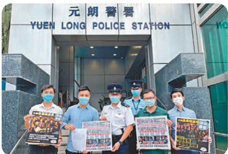
●元朗監察議會聯盟昨日到元朗警署遞交請願信。

香港文匯報訊(記者 倪恩言)《2021年公職(參選及任職)(雜項修訂)條例》日前正式刊憲生效，規定區議員宣誓擁護基本法及效忠香港特區。元朗監察議會聯盟昨日到元朗警署遞交請願信，促請警方依法跟進區內10名議員曾借出辦事處作攪炒派違法「初選」票站用途，並屢屢參與違法活動的情況，並在有需要時可將個案轉交香港警務處國家安全處及廉政公署跟進。