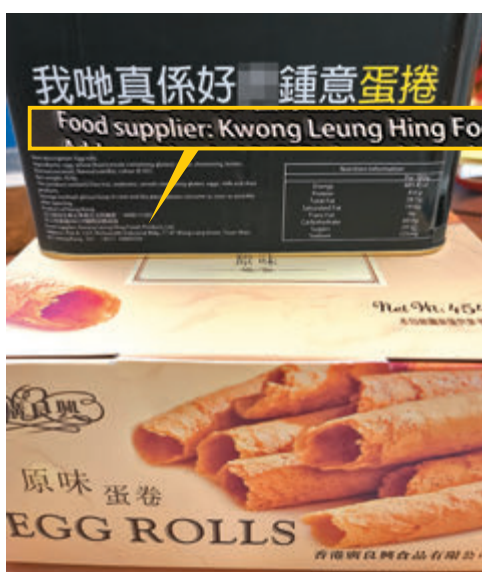
●「Glow Hong Kong」銷售的蛋卷(上)與廣良興的蛋卷(下)包裝完全不同。