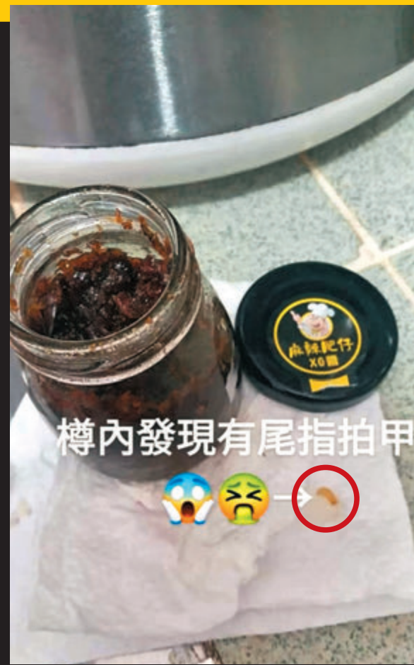
樽內發現有尾指拍甲