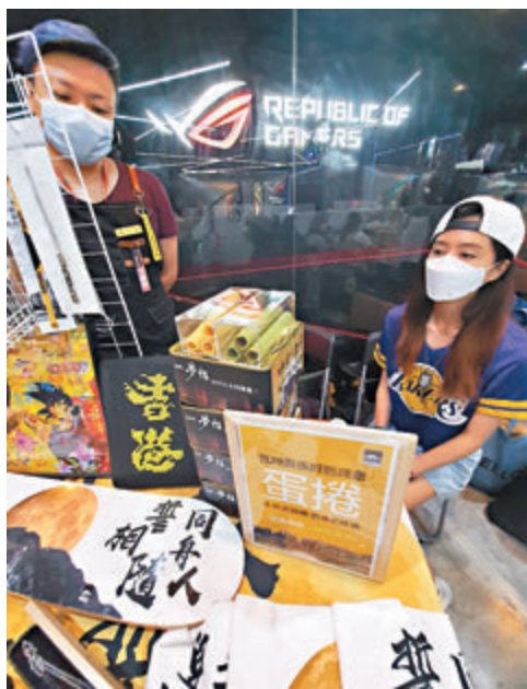
●「Glow Hong Kong」在旺角市集攤檔的店員強調蛋卷是本地製造。