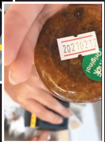
▼記者調查發現，不少黃店出售已過期的「麻辣肥仔」XO醬。