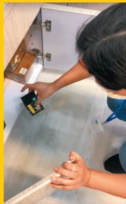
●店員尋找「麻辣肥仔」XO醬的「倉底貨」，但大部分已過期或將近到期。

大律師陸偉雄接受香港文匯報查詢時指出，商品包裝標籤虛報生產地址屬虛假陳述罪行，違反《商品說明條例》，屬於一種較普遍的罪行。他舉例指出，有商戶謊稱商品產自外國但實際上不是，或者商品標籤與事實不符，有關商戶已違反法例；另一方面，商品過期仍未落架，則違反食物及衛生方面的條例。