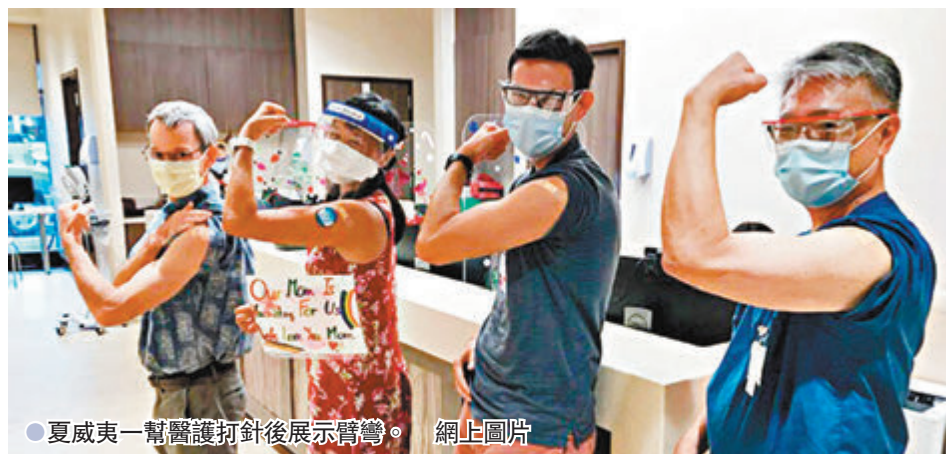
●夏威夷一幫醫護打針後展示臂彎。