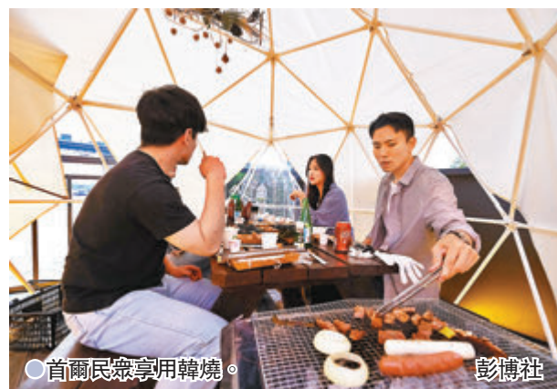
●首爾民眾享用韓燒。

蒙特利爾是加拿大第二大城市，截至4月中數據，當地主要醫療機構的醫護人員接種率都已過半，介乎58.6%至65%之間；蒙特利爾所在魁北克省的衛生部長迪貝提到，自魁省衛生部在4月9日頒布行政命令，要求部分行業員工向僱主提供接種證明以來，接種率在其後兩周便有所增長。