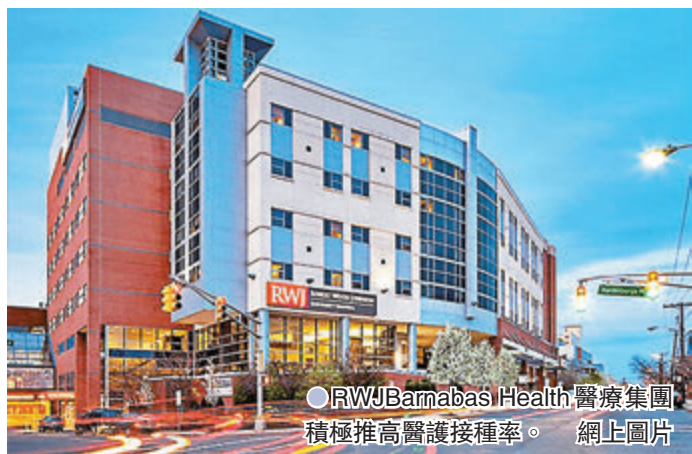
●RWJ Barnabas Health 醫療集團積極推高醫護接種率。

美國開展新冠疫苗接種計劃已將半年，不過各地仍然有醫護人員拒絕打針，近期陸續有醫療機構要求員工接種疫苗，否則可被開除，相關機構均認為，醫護人員有需要成為公眾榜樣，並提供安全的醫療環境。對於有不少機構擔心強制打針會引起法律爭議，有專家分析，只要愈多機構採取同類措施，法律理據亦會愈強。