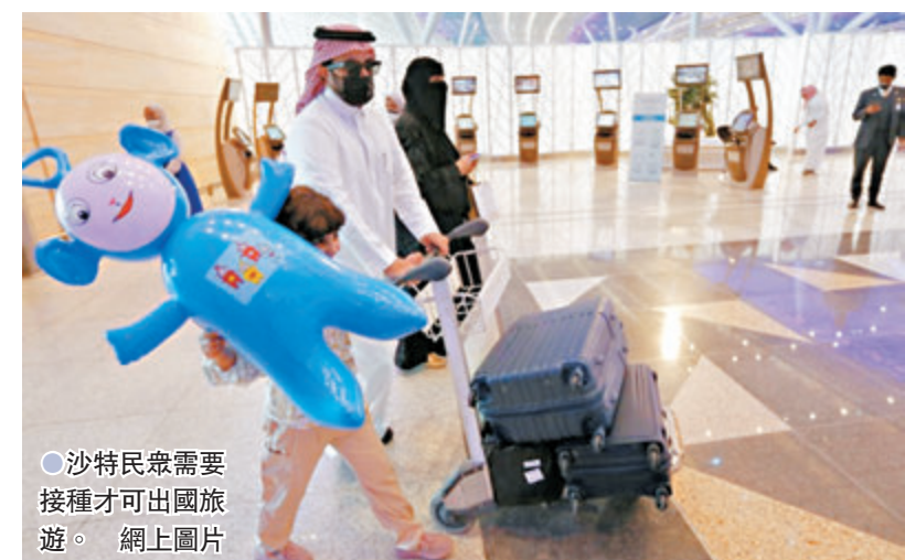
●沙特民眾需要接種才可出國旅遊。網上圖片

其他中東地區亦有同類措施，迪拜早前宣布，只准已完成接種人士現場觀看體育賽事和演唱會等活動；巴林亦禁止未接種者進入商場、餐廳和戲院等場所。 ●法新社