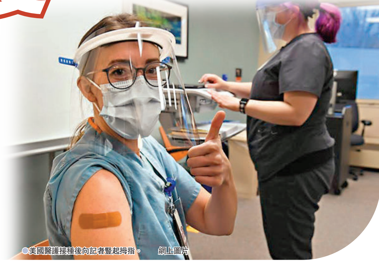
●美國醫護接種後向記者豎起拇指。