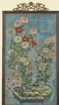
■ 乾隆拍絲珠琅御製詩洋菊圖掛屏

雜項方面，除了斯普非博物館委託的一批拍絲珠琅器之外，還有一件德國私人珍藏的「乾隆拍絲珠琅御製詩洋菊圖掛屏」同樣精彩。該掛屏高142.5cm，寬83.5cm，體積碩大。掛屏通體拍絲珠琅瑯瑯，藍色瑯瑯為地，拍絲錦地上飾九秋圖，圖中描繪長方花盆及海棠式花盆，盆上盛開的菊花艷麗奪目，方盆上還點綴有寶石。後左有一白底青花瓶，滿插舒展茂盛的紅白菊花多株。右上方鑲嵌乾隆御製洋菊詩。掛屏上方的雙龍捧日掛鉤，還保留着昔日的宮廷之風撲面而來，氣派強大。