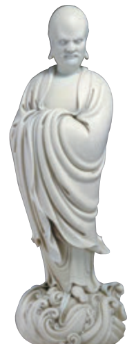
■ 何朝宗製德化窯白釉達摩像