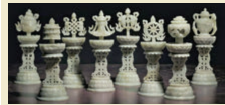
■ 清18世紀青白玉八吉祥供件

佳士得春拍尚有許多值得稱道的拍品，如來自英國黃花梨傢俱、帶銘文的北周石雕觀音立像、媲美館藏的商代青銅器、花口盤帶太平興國元年墨書紀年定窯瓷、唐三彩器物等，均彌足珍貴，限於篇幅而不贅。