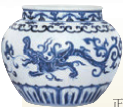
■ 宣德青花夔龍紋罐，張宗憲藏品。

2021年春天，作為亞洲藝術品交易中心的香港，正在逐漸恢復常態之中。本季首輪春拍捷報頻傳，緊接的第二輪，各方現正林馬勵兵，又將掀起一番熱潮。