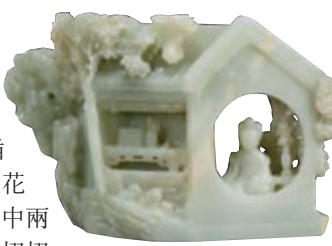
■ 乾隆青白玉西廂記人物故事山子

邦瀚斯的一組亞洲私人收藏的明清官窯瓷器等精品同樣備受矚目。其他拍品，時代跨越高古與明清，材質涵蓋金銅、瓷器、漆器、銅胎琺瑯及玉器等，門類齊全，件件精挑細選。