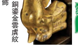
■ 漢銅鎏金雲龍紋龍型飾

5月份本港春季拍賣，香港邦瀚斯為海內外買家，準備了除了常規的中國瓷器和工藝精品專場外，「絕色·女性與中國藝術」專場則極具特色，也堪稱全球首創的有趣專題。專拍將於本月27日，假金鐘太古廣場一期20樓2001室舉行。