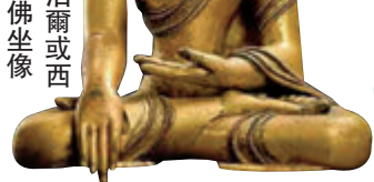
■ 13至14世紀尼泊爾或西藏鎏金銅釋迦牟尼佛坐像