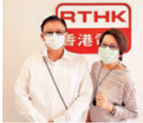
曾淵滄博士話有財富才能有自由。