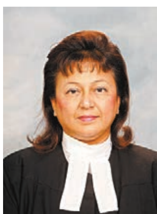
●上訴庭批裁判官錢禮犯錯。資料圖片

律政司代表昨日在上訴庭陳詞強調,案發時現場一帶冇暴動,有暴徒設置路障及縱火。當時,答辯人混在記者群中靠近警