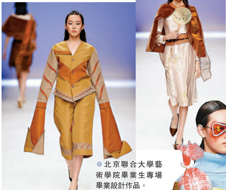
●北京聯合大學藝術學院畢業生專場畢業設計作品。

在2021中國國際大學生時裝周中，以「征途」為主題的北京電子科技職業學院畢業生亮相的作品，年輕設計師們堅定自己努力的方向，在設計創作過程中，還具備責任和奉獻意識。而且，整場發布會分為「碰撞」、「信念」、「希望」三個篇章，展示了學生從靈感獲取、主題詮釋到成品展示的創意過程。