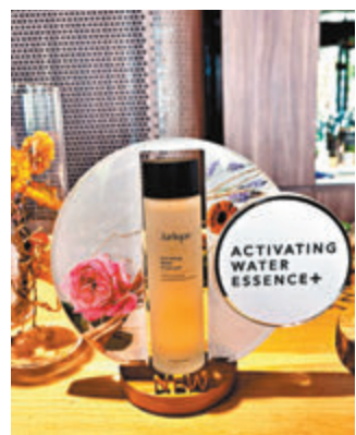
●升級版活肌水精華

以天然護膚見稱的Jurlique，不斷探索更純淨、高效的植萃活能，挑戰呵護功效的更高境界。今年，品牌再度推出全新升級版活肌水精華，糅合多種透過活機耕種所培植出來的草本植物，並以專利生化精質萃取技術，提煉出植物核心的高效護膚成分，為肌膚注入大自然的修護力量，提供48小時的長效鎖水保濕，同時全新產品包裝亦改用100%可回收材料製成。其升級版活肌水精華，凝聚雙重藥蜀葵根萃取的活性成分，並結合了品牌獨家B-drop活齡科技，將保濕功效融會提升，鎖緊肌膚水分，為下一個護膚步驟做好準備！