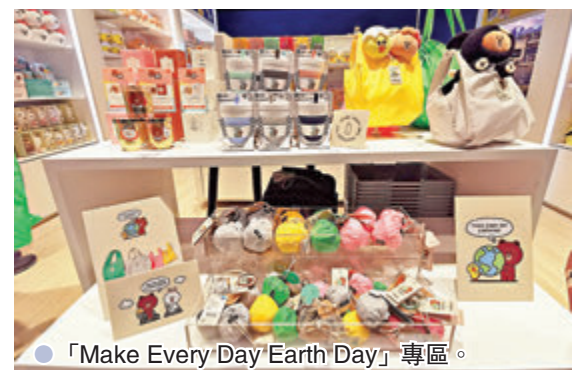
●「Make Every Day Earth Day」專區。

LINE FRIENDS 與 LINE FRIENDS POP-UP STORE 官方授權營運商JONWIN展開合作，早前正式登陸銅鑼灣希慎廣場及觀塘apm，以「HAVE A NICE TRIP」為主題，色彩鮮艷的主色令人眼前一亮，其一系列跨界合作精品及香港專屬限定BROWN & FRIENDS及BT21周邊商品，再次成為一眾時尚年輕朋友必訪的最新朝聖點！店舖設計貫徹簡約時尚感，今次更破格將傳統與時尚融合在一起，以傳統空郵專用信封為設計靈感，以藍、白、橙為主調，帶出環遊世界的主题，猶如BROWN & FRIENDS專程到世界各地搜羅不同類型的既可愛又實用的商品。另外，店內設有「Make Every Day Earth Day」專區，集合該主題活動的BROWN & FRIENDS環保生活單品讓粉絲們選購。