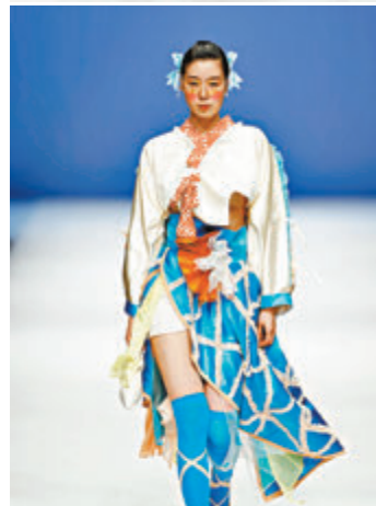
●東北電力大學服裝與服飾設計專業畢業設計作品