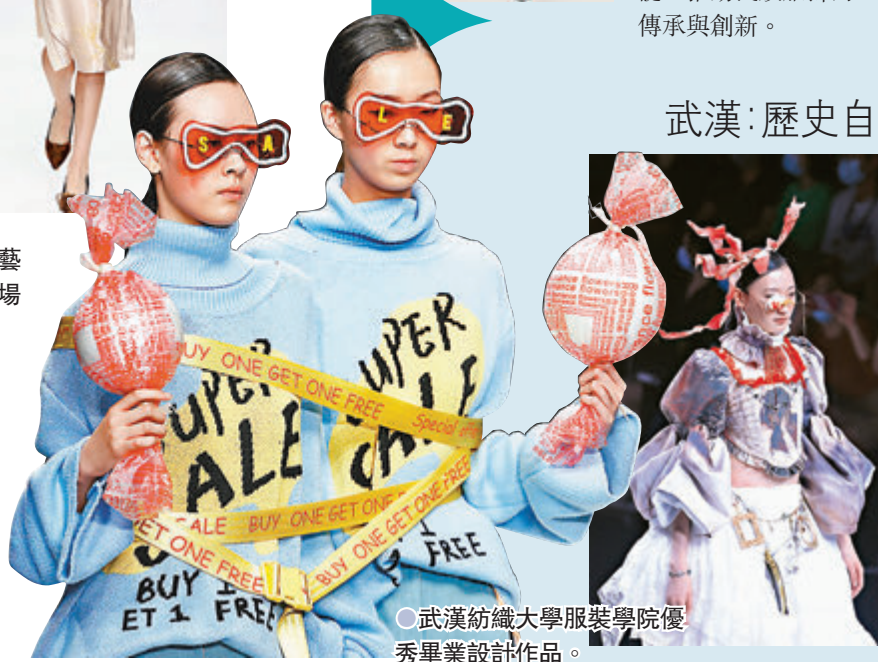
●武漢紡織大學服裝學院優秀畢業設計作品。

同時，北京聯合大學藝術學院畢業生專場發布了70套畢業設計作品，展現了20位年輕設計師對「尋」的理解和表達，「尋」即是回望，也是展望，通過深入了解過往文化，捕獲對於「古老痕跡」的記憶，將民族的文化、先人的智慧與當下融合，讓歷史的「芬芳」在當代迸發。