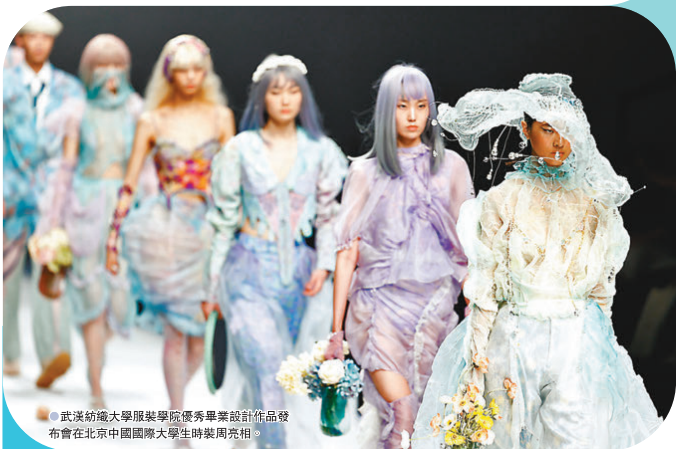
●武漢紡織大學服裝學院優秀畢業設計作品發布會在北京中國國際大學生時裝周亮相。

中國服裝設計師協會主席張慶輝介紹，大學生時裝周已成為促進大學生創業、就業的孵化器，激勵新生代設計師走進市場、貼近市場，通過創新創造，為中國時尚產業注入生機。