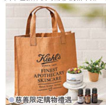
●慈善限定購物禮遇

為慶祝品牌創業170周年，Kiehl's推出皇牌經典限量版系列，特別匯集品牌一直備受擁戴的熱賣產品，其中包括深夜奇跡修復精華露、特效保濕乳霜、金盞花植物精華爽膚水及牛油果眼霜。