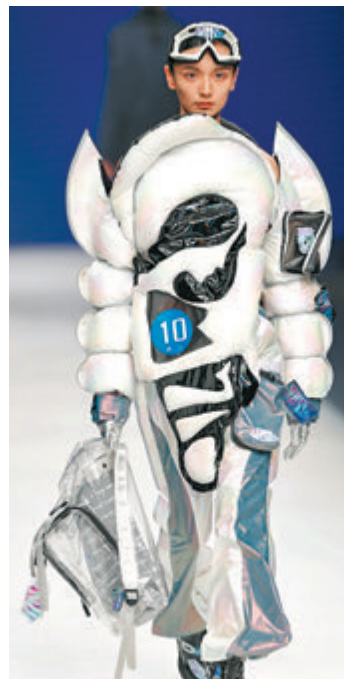
●「第26屆中國時裝設計新人獎評選」參賽作品。

另外，武漢紡織大學服裝學院優秀畢業生作品發布會亦在大學生時裝周亮相，年輕的設計師們回眸過去，擁抱未來，堅持綠色、低碳與可持續，以包容的時尚態度和科技視角，讓歷史文化與自然生態和諧交融，運用手中的絲絲縷縷織造生活中的美好與健康。