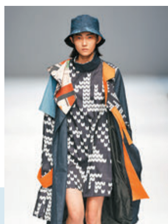
●閩南理工學院服裝與藝術設計學院畢業生作品