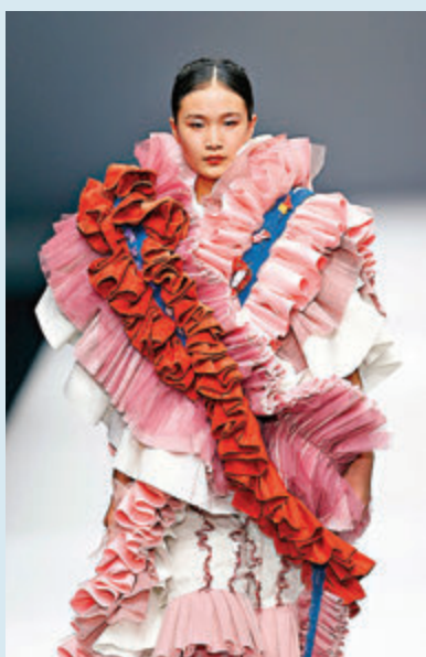
●閩南理工學院服裝與藝術設計學院畢業生作品