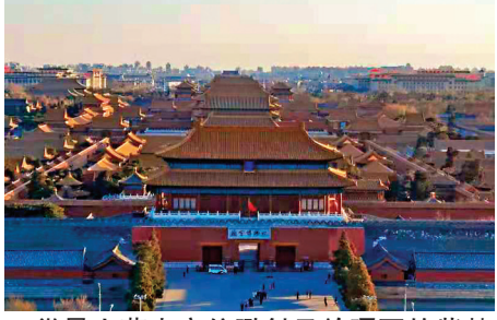
●從景山萬春亭俯瞰斜日餘暉下的紫禁城。

說到底，紫禁城的出身，不過是愛新覺羅氏的家院。精美的建築、珍稀的器皿、絕世的字畫，搜羅天下以充一室。