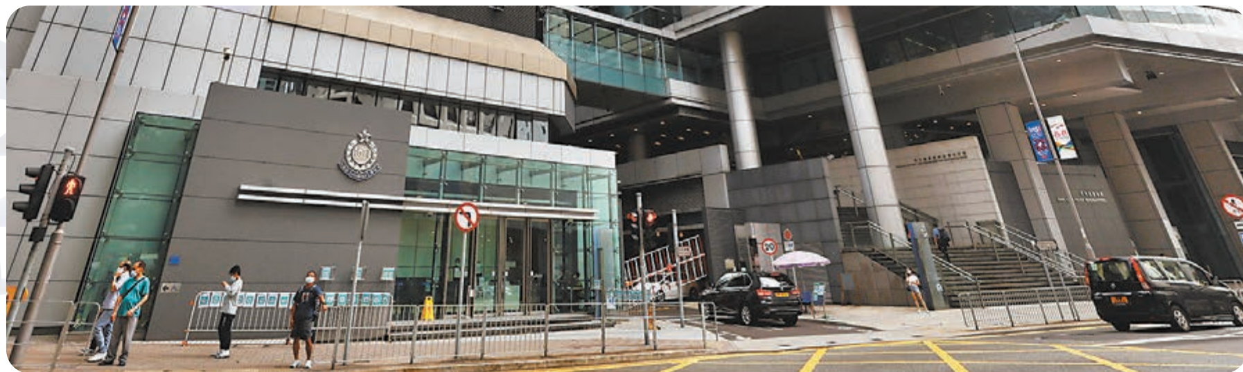
灣仔警署一名駐守巡邏小隊的35歲男警初步確診，但有消息指其二次檢測結果呈陰性。圖為灣仔警署。