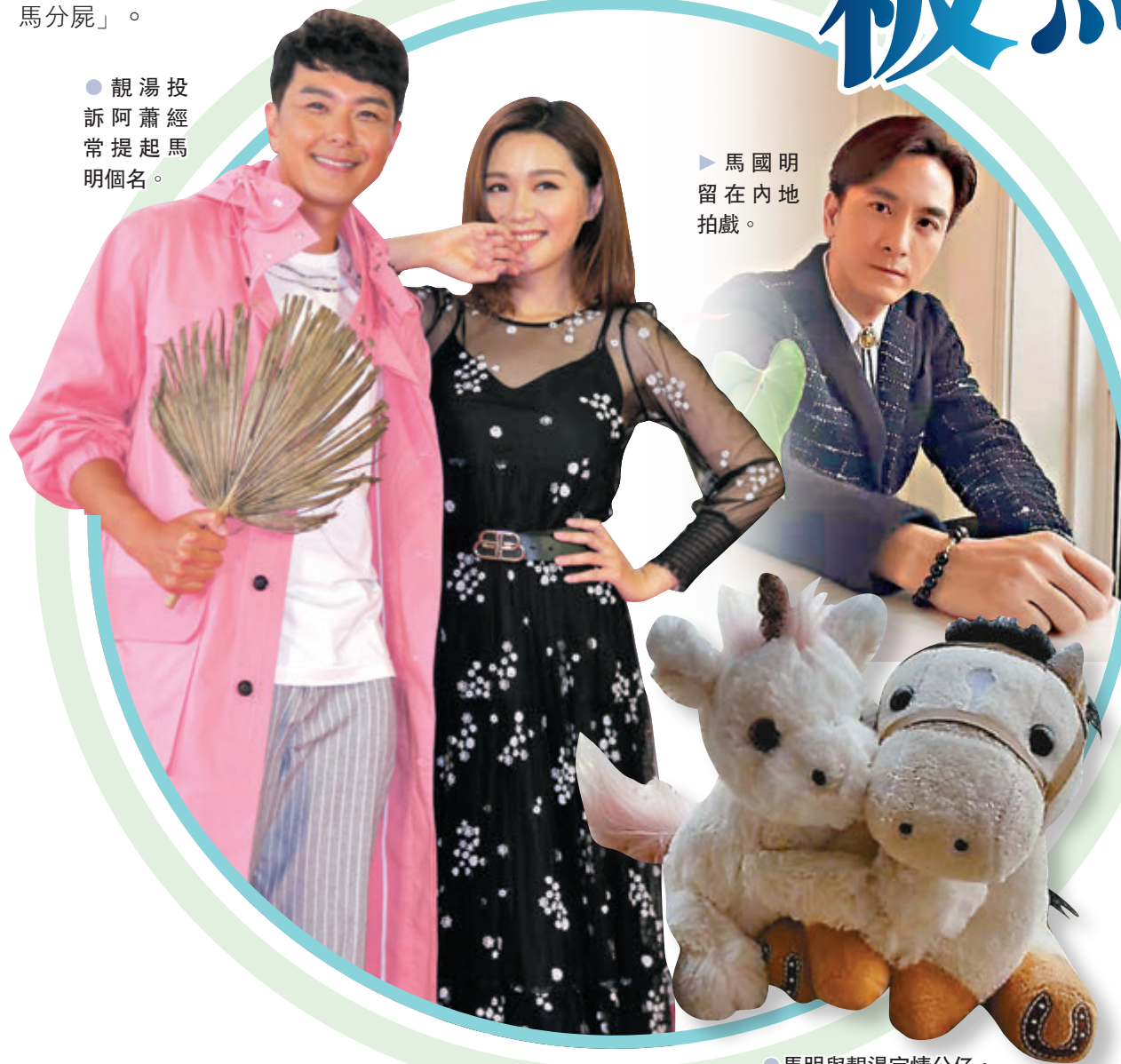
●馬明與靚湯定情公仔。

阿蕭在劇集首播時，所演角色長滿紫色毒瘡，雖然只是播出短劇1分鐘卻拍足幾日，他透露：「這個妝會不時在夢境出現，每次都要花上3小時去化，有時太累好眼瞓，同事便托住我個頭化，我都試過『打橫瞓』住畀人化，有時太累真的沒法子。」在旁的靚湯笑他似先人化妝，阿蕭即說：「都係試過一次，知道『打橫瞓』化妝不是太吉利，以後不敢再試，(擲番封利是?)你畀我咩！」