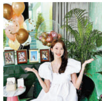
●少女時代成員允兒前晚直播慶祝自己生日。