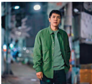
●男神李昇基近日戀情曝光。

香港文匯報訊(記者 文芬)少女時代成員允兒前晚直播慶祝自己的生日，雖然已經31歲，但允兒的狀態好似18歲，讓粉絲紛紛表示十分羨慕。