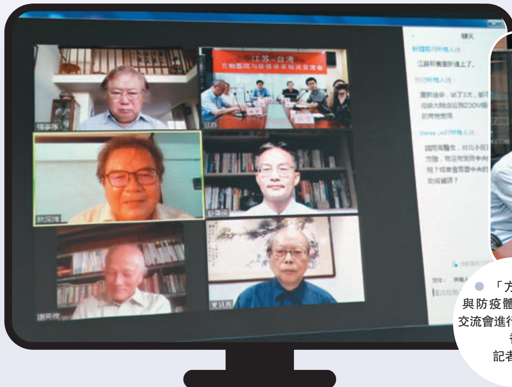
「方艙醫院與防疫體系」視訊交流會進行中。