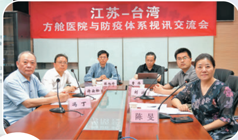
●視訊交流會南京會場。