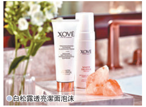
● 白松露透亮潔面泡沫