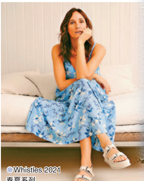
● Whistles 2021 春夏系列