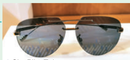
● City Pilot Tokyo

另外，RIMOWA 的 City 系列中，兩款 Pilot Rio 及 Tokyo 太陽眼鏡，採用了有色反光鏡片，靈感源自巴西著名的科帕卡瓦納海灘步道，以及日本澀谷的十字路口。其獨特的鏡片配以簡約的機師型鏡框，並採用創新的多層反光結構，塑造奪目的鑄刻效果。