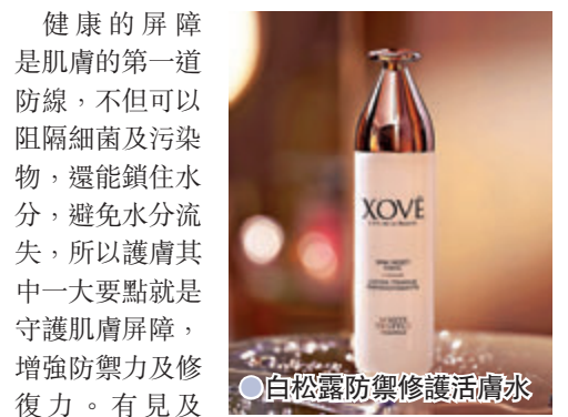
● 白松露防禦修護活膚水

健康的屏障是肌膚的第一道防線，不但可以阻隔細菌及污染物，還能鎖住水分，避免水分流失，所以護膚其中一大要點就是守護肌膚屏障，增強防禦力及修復力。有見及此，XOVE 推出全新產品「白松露透亮潔面泡沫」及「白松露防禦修護活膚水」，兩個步驟修復屏障，為肌膚補充 SOD，有效從根源抗氧修復，維持肌膚健康年輕。當中全新白松露透亮潔面泡沫，採用嶄新油分兌換概念，以豐盈綿密的泡沫，深入淨化毛孔，先去除皮膚紋理內的殘餘化妝品及油脂污垢，再補充優質保溼精華，洗後不繃緊，同時重建肌膚屏障。而白松露防禦修護活膚水，能有效補充肌膚所需礦物質，增強肌膚自癒、防禦及吸收能力，舒緩敏感泛紅，有效保持肌膚水分。