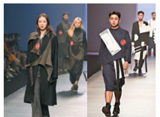
● 廣州南洋理工職業學院學生展示該校學生設計的服裝

早前，廣州南洋理工職業學院服裝設計畢業作品展演亮相 2021 中國（廣東）大學生時裝周，今次展演以「數賦霓裳」為主題，學生們在老師的指導下，運用多種設計元素及面料，展現該校推動服裝產業數字化轉型的成果。