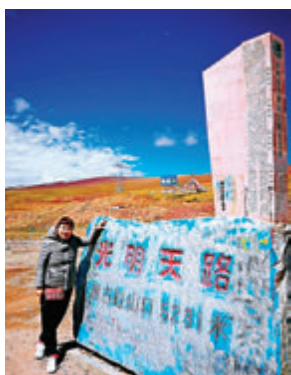
●到達海拔5,231米的唐古拉山口。

從那曲市到長江源，距離有412公里，明天，我們將走完這412公里到達長江源。在這裏，我可以代親愛的爸爸媽媽親親長江源頭，親親長江源頭第一橋，親親長江流域第一哨站，向解放軍叔叔問個好！