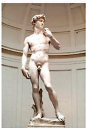
●米開朗琪羅傑出的作品——大理石《大衛》石像。（資料圖片）