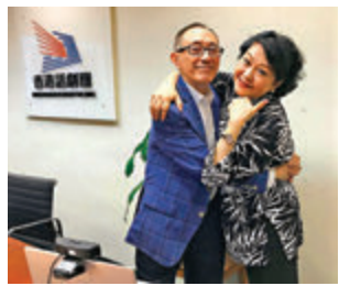
●美儀姐開心擁着毛老師！

因為和美儀姐之前常聯繫，所以就計算這些年因各種原因少見了，但美儀姐每有什麼狀況也還是會和我分享。今天能看到毛老師的精湛演技，也是要多謝她呢！不過因為疫情，加上毛老師還有最後一個夜場的演出，我們沒有去打擾他。況且我和老友看着毛Sir的演出，已不其然想起患上認知障礙症的至親，情緒都被牽動着，還未回復過來！只好在此向他說句，毛老師，正呀！