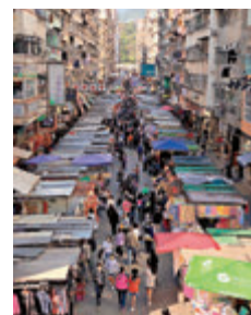
●圖片是舊年拍攝於疫情稍稍轉好之後人來人往的旺角街市。

鍾南山院士說，未來可能要定期接種新冠疫苗。從目前的情況來看，鍾院士的判斷很大可能會成為現實。最早接種國藥疫苗的阿聯酋和巴林兩國，先後宣布將為國民接種第三針疫苗加強針。好消息也正在不斷湧現，隨着各類技術路線疫苗的不斷被研發，之後投產的新冠疫苗，不僅只需打一針，甚至口服或噴鼻式的疫苗也將陸續問世。屆時，快速、大規模、便捷的接種方式，必然會消解掉未來因為需要定期打疫苗而產生的厭煩情緒。