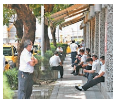
●台灣疫情升溫，昨日機場排班的計程車司機在戶外陰涼處等待乘客，成為另類群聚。中央社