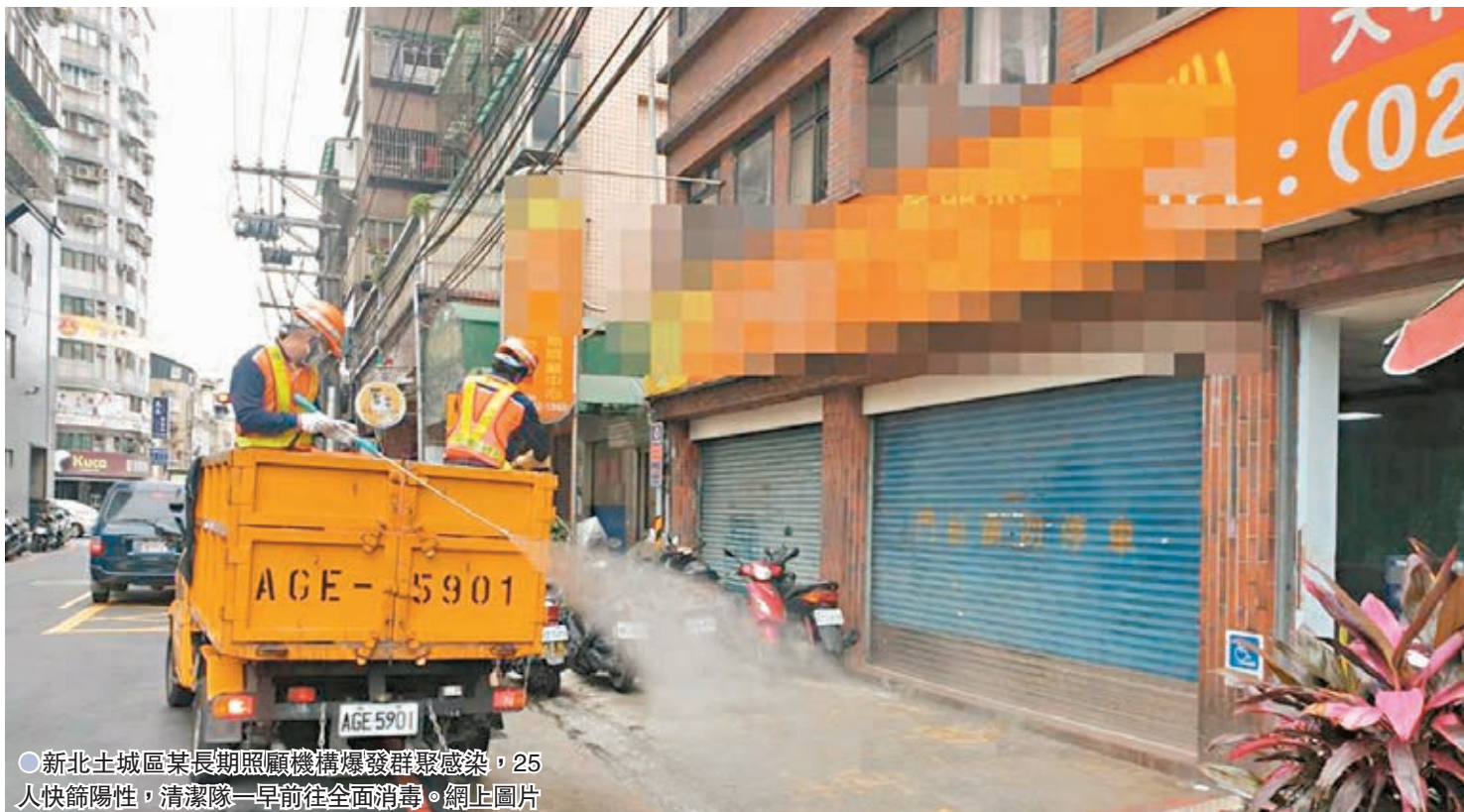
●新北土城區某長期照顧機構爆發群聚感染，25 人快篩陽性，清潔隊一早前往全面消毒。

指揮中心統計，截至目前台灣地區累計 9,389 例新冠肺炎確診病例，含 8,195 例本土病例。確診個案中 149 例死亡。