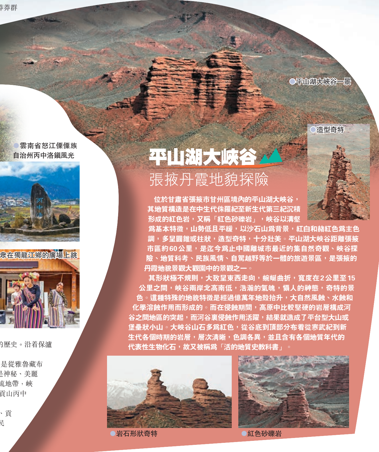
● 平山湖大峽谷一景