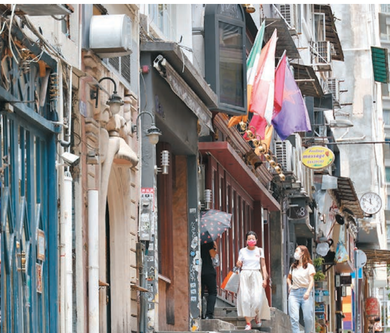
● 中環大街小巷有不少舊式建築