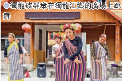
● 獨龍族群眾在獨龍江鄉的廣場上跳舞