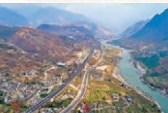
● 保滬高速、美麗公路南延線與怒江

峽谷幽靜深邃，怒江奔騰咆哮，令人震撼，沿峽谷的瀘水、貢山、福貢等幾縣境內生活着傣族、怒族、獨龍族、藏族等民族，給怒江大峽谷增添了不少樂趣。例如，在峽谷中，你可以欣賞到怒江傣族自治州貢山獨龍族怒族自治縣丙中洛鎮風光，亦有獨龍族群眾在獨龍江鄉的廣場上跳舞等。