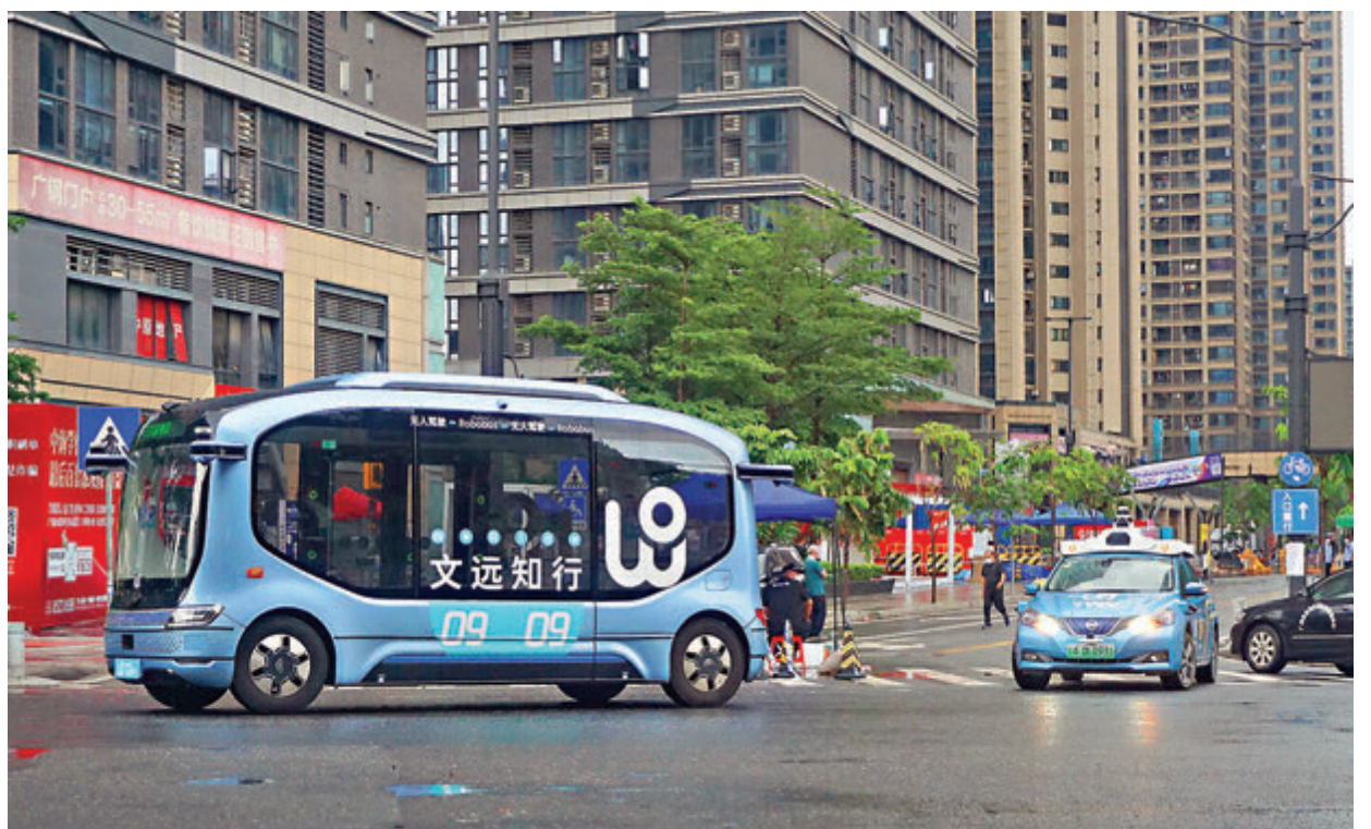
●廣州從3日起對位於荔灣區南部面積46.2平方公里的芳村片區實施整體封控。廣州中心城區六區全部開展全員篩查。圖為無人駕駛車輛在荔灣區芳村疫區運送物資。

珠江隧道、洲頭咀隧道和鶴洞大橋是芳村通往廣州主城区的3條主要通道。4日上午，仍有車輛試圖嘗試進入，但值守交警未放行。一位廂式小貨車女性司機說，她3日下午從海珠區運貨到芳村，卸完貨返回時，剛好遇到交通管制，無法回到公司。3日晚，她在芳村一家酒店住了一晚。「我不能天天住酒店，開銷太大。」她向交警申訴道。交警表示，疫情防控是很嚴肅的事，必須遵守規定，不能隨意出入。